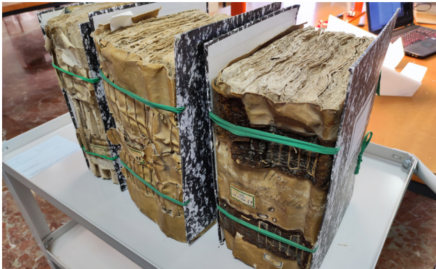
Imatge 1. Llibres de cèdules dels anys 1403, 1407 i 1422 conservats a l'Arxiu del Regne de València.