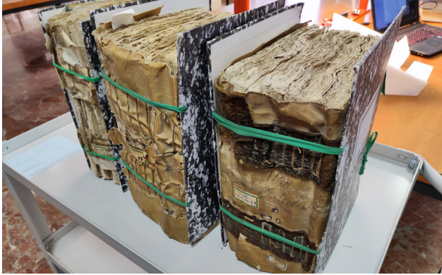
Imatge 1. Llibres de cèdules dels anys 1403, 1407 i 1422 conservats a l'Arxiu del Regne de València.