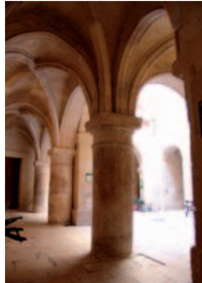
Fig. 24. Birgu. Castellania (poi palazzo dell'Inquisitore), veduta del cortile interno.

l'aspetto massiccio dell'insieme, del resto, richiamano analoghi caratteri del cortile interno dell'ospedale dei Cavalieri a Rodi; l'ingresso al cortile avviene, inoltre, attraverso un portale a piattabanda con modanatura a bastoni in linea con esempi siciliani di primo Cinquecento.