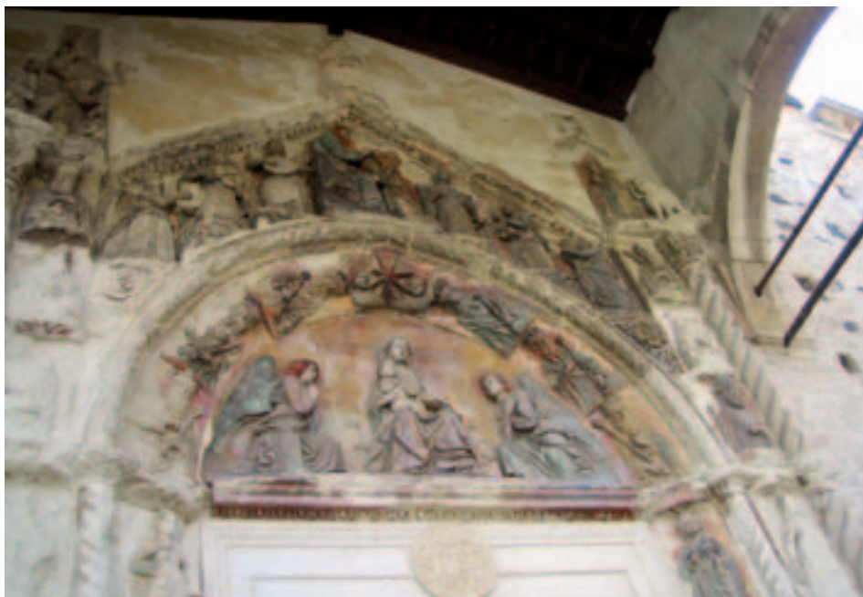
Fig. 7. Militello. Chiesa di S. Maria la Vetere, portale (1506).