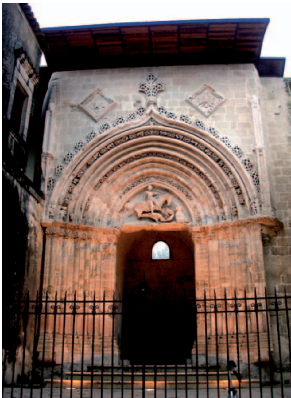
Fig. 1. Ragusa. Portale della chiesa di S. Giorgio.