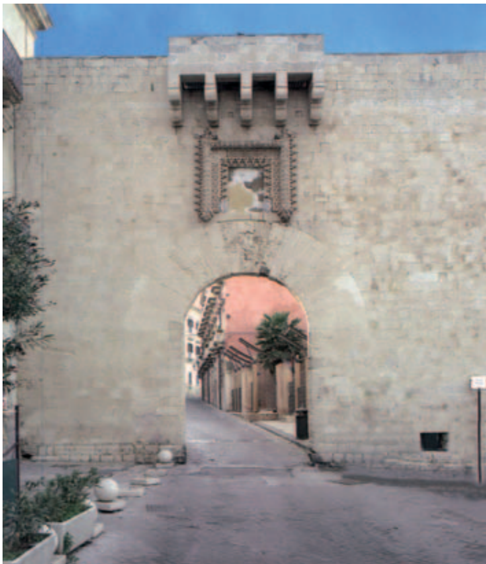
Fig. 9. Siracusa. Porta Marina. Prospetto esterno.