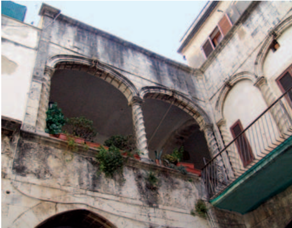
Fig. 14. Siracusa. Palazzo Abela. Cortile, particolare della loggia al piano nobile.

mano orgogliosamente la propria opera all'interno di cartigli scultorei [fig. 16]. I nuovi sostegni a sezione cilindrica, ma molto tozzi, con capitelli in prevalenza corinzi e figurati, mirano a ricondurre la fabbrica preesistente allo schema della chiesa colonnare. La mescolanza di citazioni classiciste, motivi neomedievali e fantastici conduce complessivamente a esiti che sfuggono a una qualsiasi classificazione stilistica.