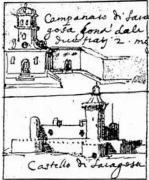
Fig. 15. Tiburzio Spannocchi, schizzo del campanaro de Saragosa [1578; da Dufour, L., Siracusa: città e fortificazioni, Palermo 1987].

Il cantonale di un palazzetto a Siracusa offre, invece, una originale interpretazione del tema della sovrapposizione degli ordini architettonici, dimostrazione di un approccio libero e antidogmatico anche su questioni paradigmatiche del classicismo. Una colonna ionica con fregio pulvinato (di probabile ispirazione serliana) è sormontata da una corinzia; la sovrapposizione con il dorico sembrerebbe svolgersi invece in orizzontale essendo entrambe le colonne contenute in una parasta gigante che marca il cantonale, attualmente priva della terminazione, ma che nella parte restante appare dorica o tuscanica. 46 Qualcosa di analogo presentava forse il palazzo senatorio di Noto antica, in costruzione nel 1561 e non più esi-