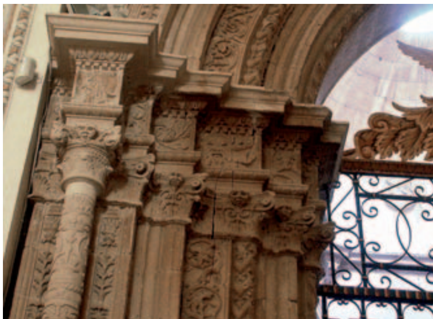
Fig. 12. Modica. Cappella dei Confrati in S. Maria di Betlem, particolare dell'arco di ingresso.