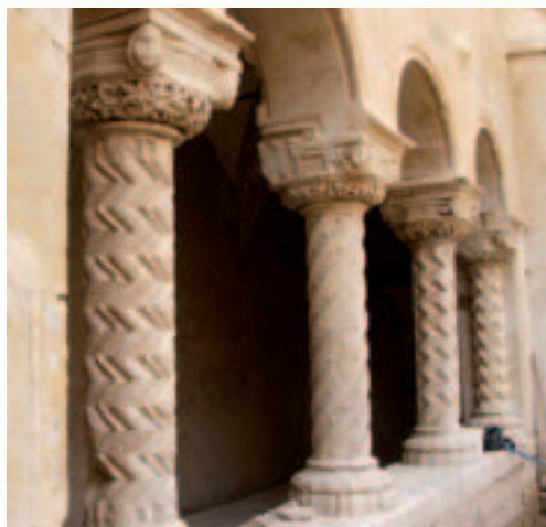
Fig. 5. Modica. Complesso di S. Maria di Gesù. Chiostro, particolare dei sostegni del primo ordine del loggiato.