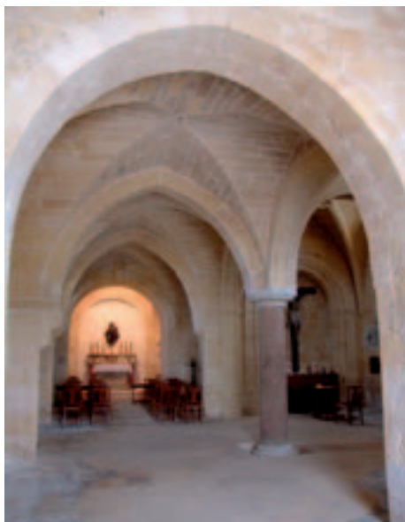
Fig. 21. Birgu. Forte S. Angelo. Chiesa di S. Anna, veduta dell'interno.