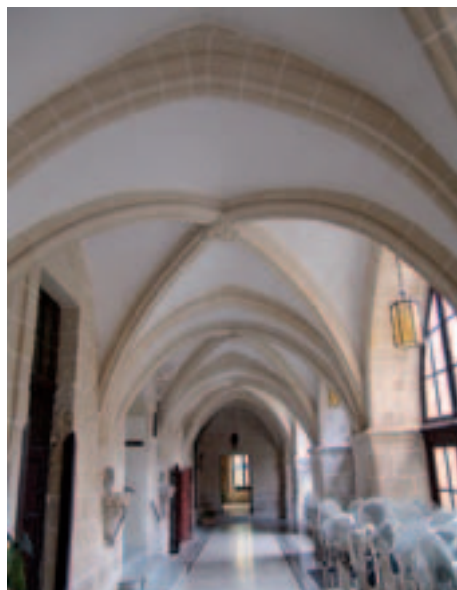
Fig. 22. Rabat. Complesso conventuale dei Francescani Ossevanti, crociere del chiostro.

una versione un po' rozza, che mostra significative analogie con la soluzione attuata nel chiostro di S. Maria di Gesù a Modica, non a caso, dello stesso ordine.