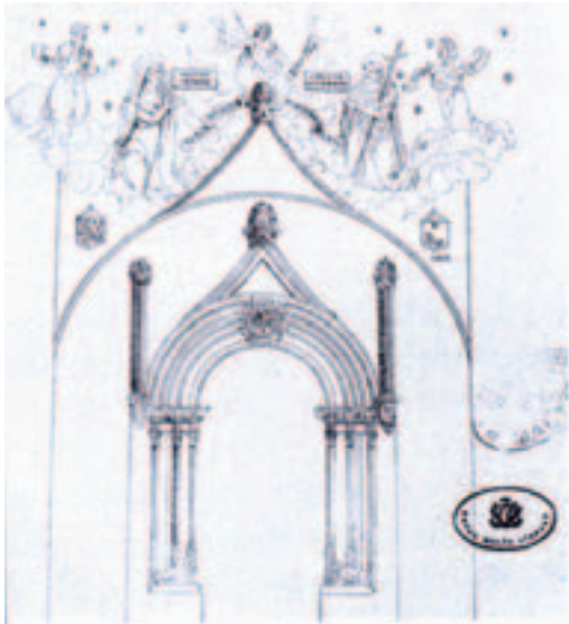
Fig. 23. Birgu. Portale della prima Sacra Infermeria (oggi complesso conventuale di S. Scolastica).