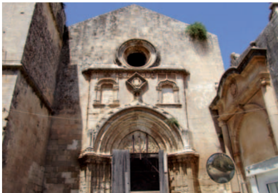
Fig. 3. Modica. Complesso di S. Maria di Gesù. Facciata della chiesa.