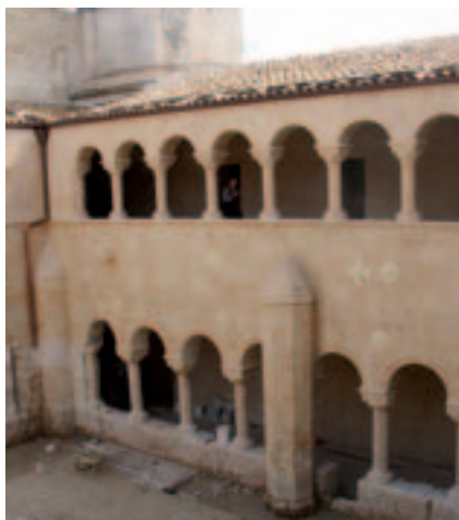
Fig. 4. Modica. Complesso di S. Maria di Gesù. Chiostro, veduta generale.