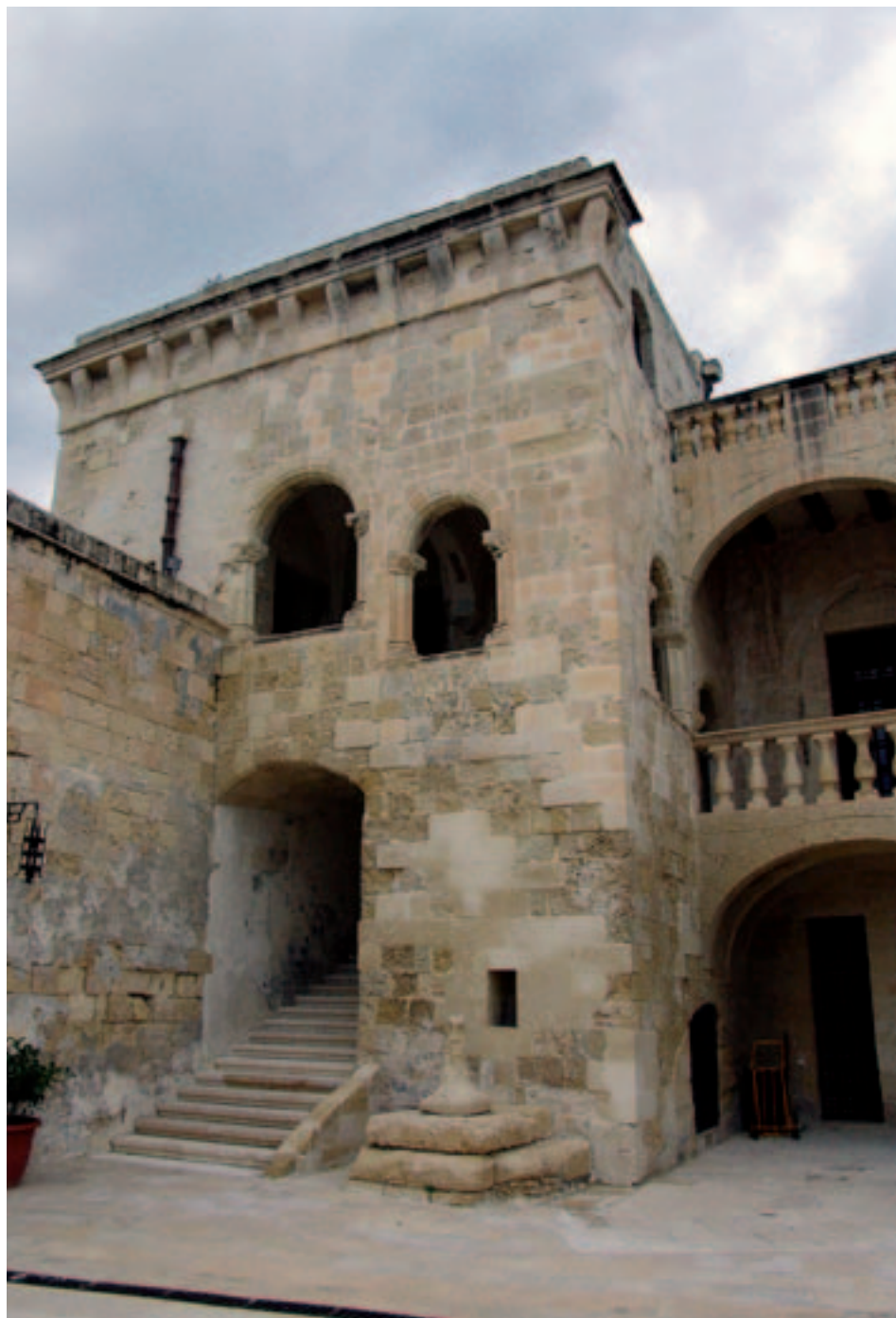
Fig. 20. Birgu. Forte S. Angelo. Residenza del Gran Maestro, prospetto della scala loggiata.