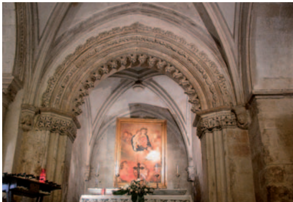
Fig. 2. Ragusa. Cappella della Candelora in S. Maria delle Scale.