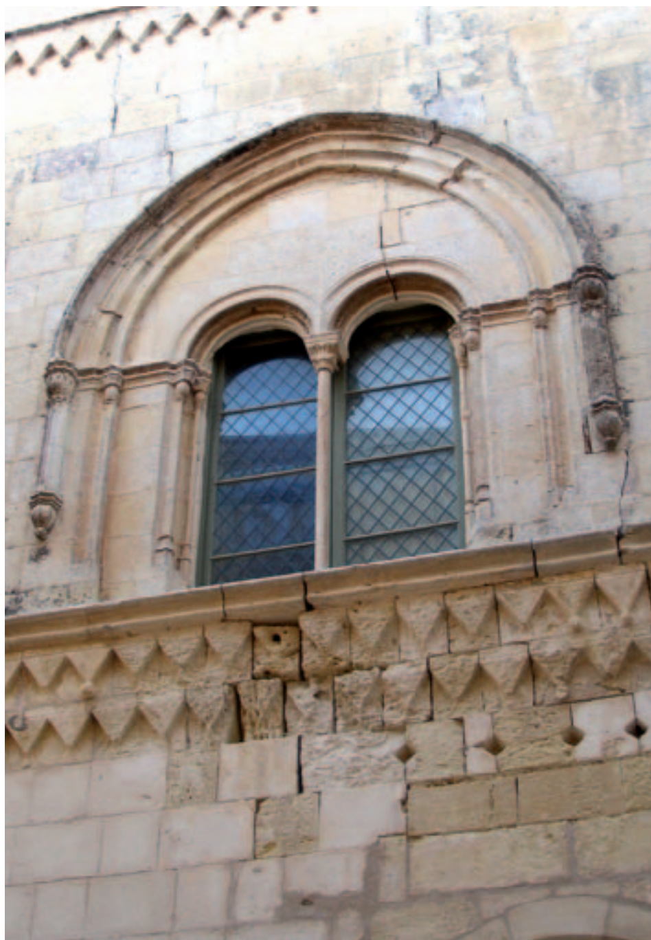
Fig. 18. Mdina. Palazzo Falson, particolare di una bifora del prospetto principale.