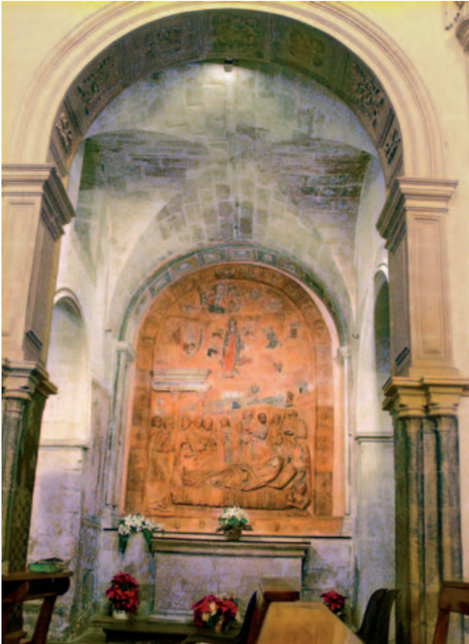
Fig. 13. Ragusa. Cappella della Dormitio Virginis in S. Maria delle Scale.