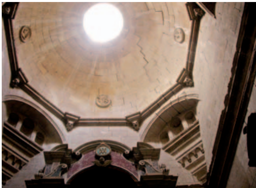
Fig. 11. Modica. Cappella dei Confrati in S. Maria di Betlem, particolare della volta.