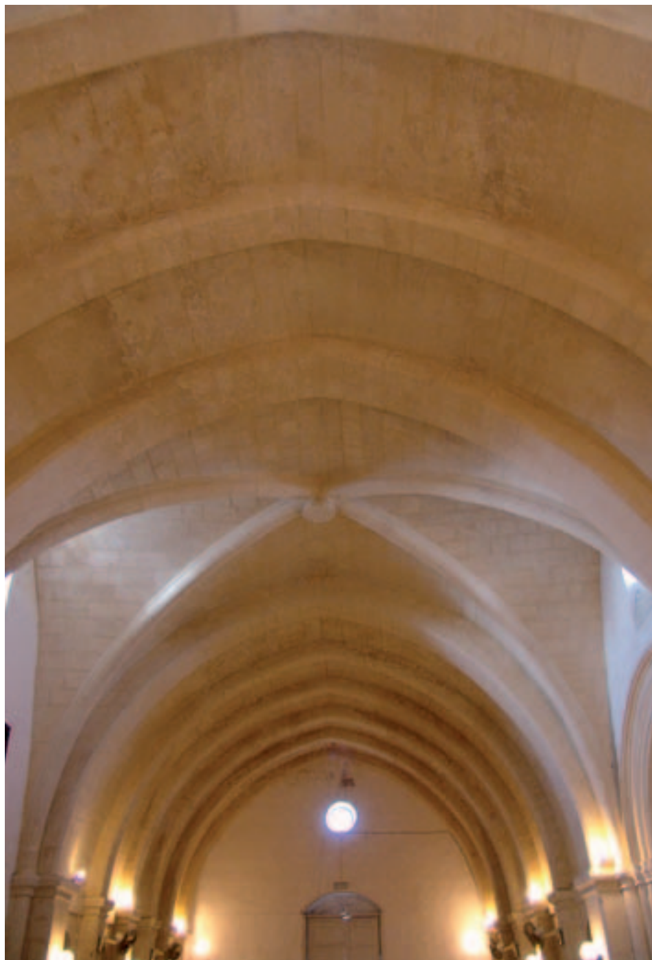
Fig. 19. Zejtun. Chiesa di S. Gregorio, veduta dell'interno.