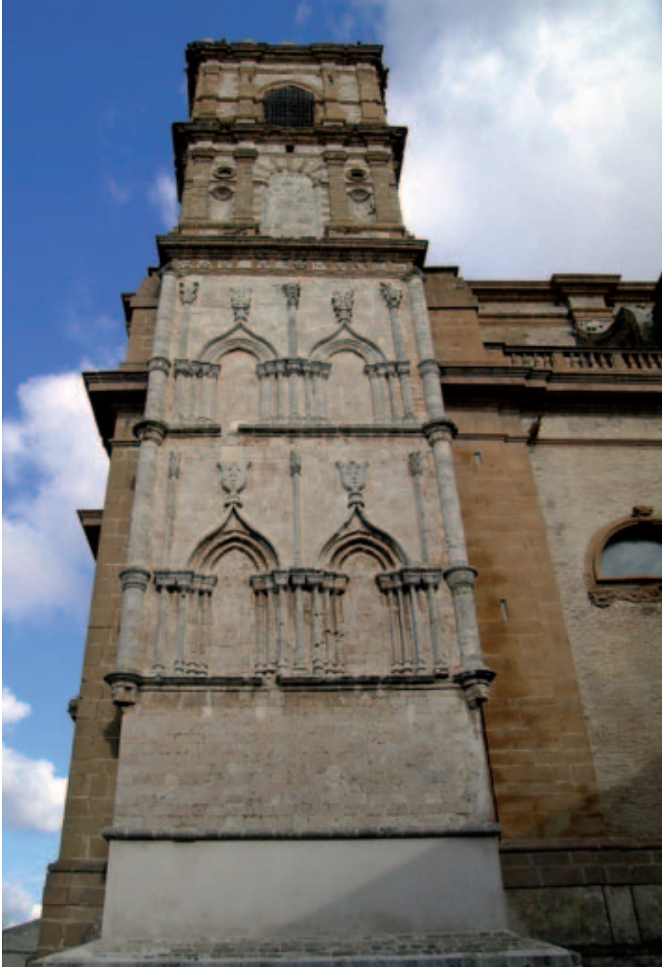
Fig. 17. Piazza Armerina. Cattedrale, campanile.