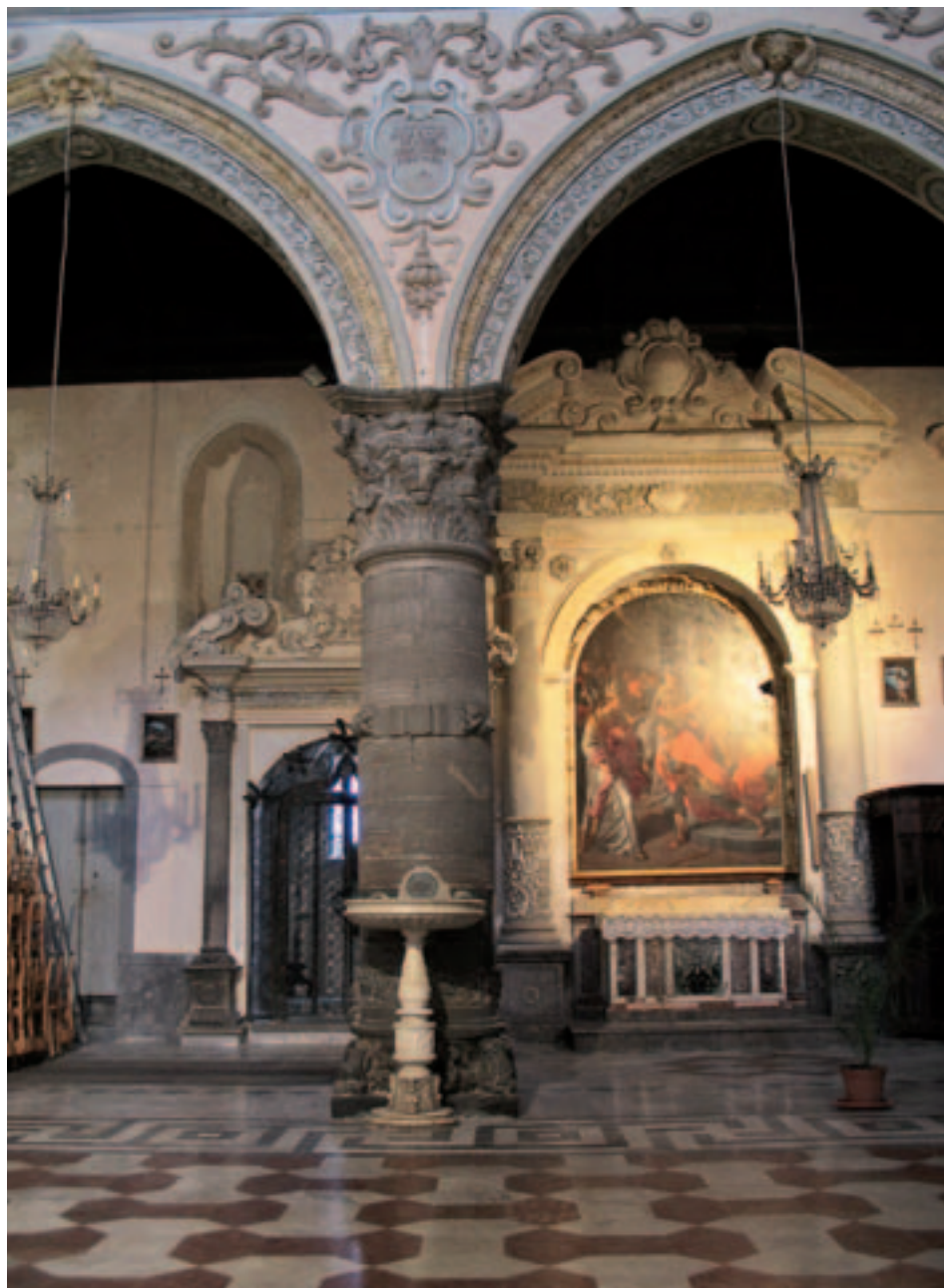
Fig. 16. Enna. Duomo. Navata centrale, particolare della prima colonna sulla sinistra (Giandomenico Gagini, 1560-61).