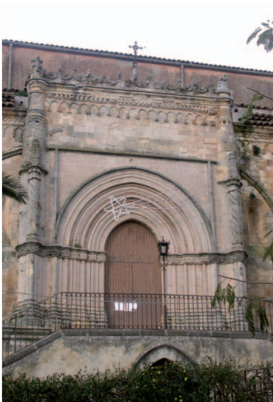
Fig. 6. Vizzini. Portale inserito sul fianco della chiesa madre (1539).