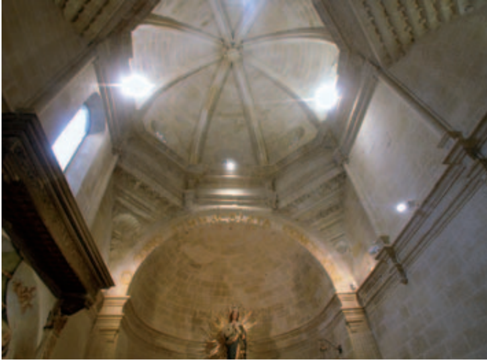
Fig. 10. Comiso. Cappella Naselli in S. Francesco, particolare della soluzione di copertura.

Cinquecento perché il linguaggio rinascimentale inizi ad avere maggiore presa su una committenza ampia e variegata.