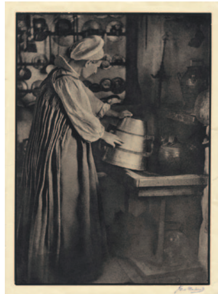
Fig. 4. José Ortiz Echagüe. Ansotana (ca. 1927). Carbón directo sobre Papel Fresson. 39,6 x 29,6 cm.