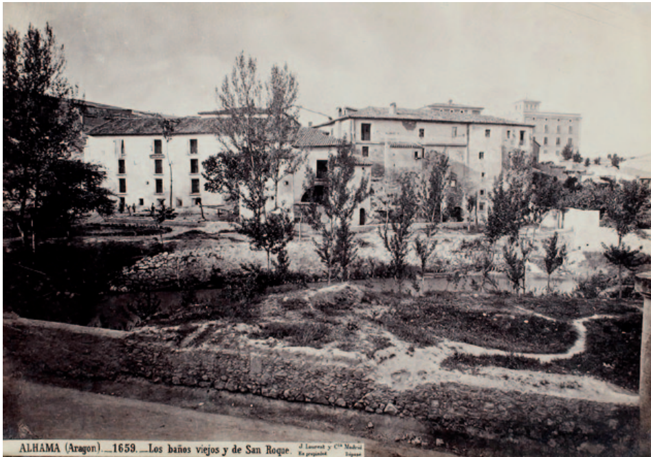
Fig. 13. Juan Laurent. Alhama, Aragón, Los baños viejos y de San Roque. (1877). Papel a la albúmina a partir de negativo de colodión húmedo. 9,4 x 13,4 cm.

zación de un álbum sobre el Museo de la ciudad con vistas a la Exposición Universal de París de 1878. 15 Así lo corrobora la firma que aparece impresa en las copias positivas, J. Laurent y C ia , una sociedad que se había constituido en 1873, de modo que, estas fotografías deben haberse hecho con posterioridad a esa fecha.