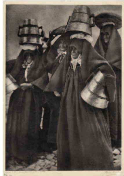
Fig. 2. José Ortiz Echagüe. El agua y el pan, Ansó (ca. 1927). Carbón directo sobre Papel Fresson. 35,9 x 25,2 cm.