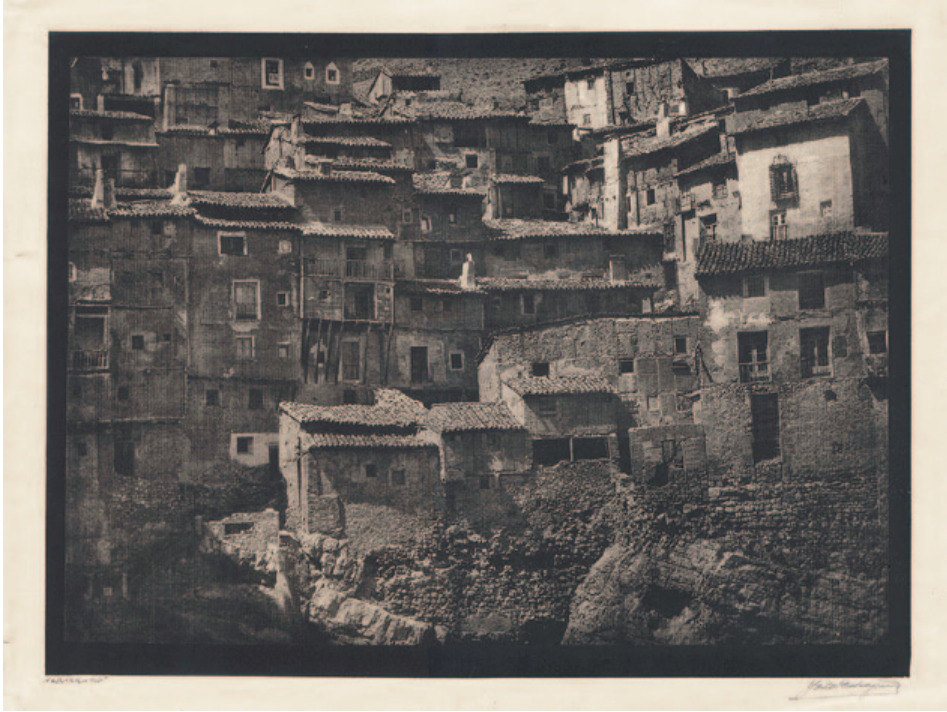
Fig. 5. José Ortiz Echagüe. Casas de Albarracín (ca. 1935). Carbón directo sobre Papel Fresson. 343,3 x 56,4 cm.