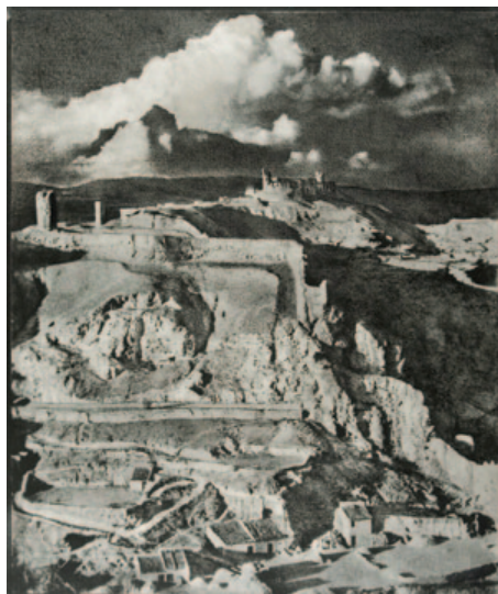
Fig. 8. José Ortiz Echagüe. Cerros de Calatayud (1954). Carbón directo sobre Papel Fresson. 49,7 x 40,3 cm.

una invitación para participar en la Exposición Universal de París que se estaba preparando para 1867. Del Valle, gran aficionado a la fotografía, determina presentar allí unos álbumes temáticos en los que se recogiera un amplio reportaje gráfico de los trabajos de construcción de puentes, carreteras, caminos de hierro, faros, puertos, etc. que se habían construido o estaban en proceso de ejecución con objeto de ofrecer una imagen de España de avance y progreso. 7 Laurent requirió la colaboración del fotógrafo José Martínez Sánchez y ambos se repartieron el espacio geográfico, quedando Laurent encargado de fotografiar las obras de la mitad oeste y Martínez Sánchez las de la mitad este. Para esa Exposición Universal se elaboraron cinco álbumes, y a partir de ahí y hasta 1878, por distintas motivaciones, se llevaron a cabo nuevas ediciones de los álbumes con las fotografías agrupadas en un número variable de tomos, entre tres y cuatro. 8