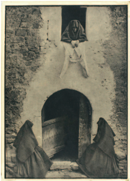
Fig. 3. José Ortiz Echagüe. Portal de Ansó (ca. 1927). Carbón directo sobre Papel Fresson. 39,4 x 28,9 cm.