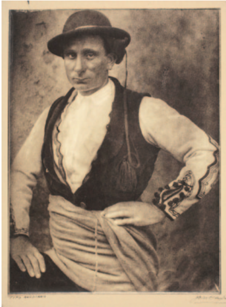
Fig. 1. José Ortiz Echagüe. Ansotano (1927). Carbón directo sobre Papel Fresson. 37 x 27,5 cm.