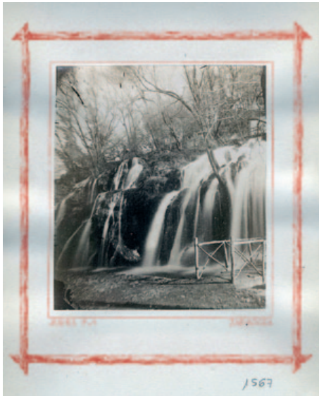
Fig. 11. Mariano Júdez y Ortiz. Cascada Yris. (1866). Papel a la albúmina a partir de negativo de colodión húmedo. 15,1 x 23,3 cm. Álbum Vistas del Monasterio de Piedra