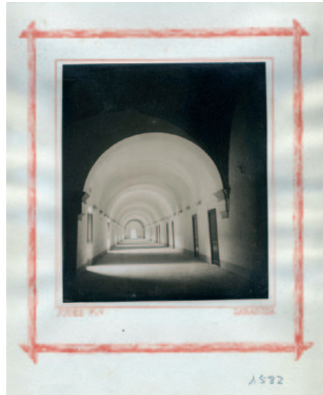
Fig. 12. Mariano Júdez y Ortiz. Hospedería. (1866). Papel a la albúmina a partir de negativo de colodión húmedo. 15,1 x 23,3 cm. Álbum Vistas del Monasterio de Piedra

la Torre Nueva de Zaragoza (1868-1874) 12 y que el autor ofrecía a la venta en su establecimiento de la Calle del Coso.