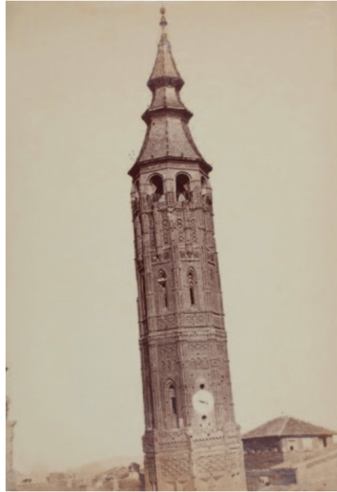
Fig. 14. Charles Clifford. Torre Nueva de Zaragoza. (ca. 1860). Papel a la albúmina a partir de negativo de colodión húmedo. 43 x 29,4 cm.

lización de encargos o el interés por la promoción de personas o lugares, propiciaron una producción fotográfica de enorme interés para conocer la realidad del 1900. Los fenómenos con que se inaugura el siglo XX, el regionalismo y regeneracionismo, propiciarán la búsqueda de un sello de identidad en la cultura y las tradiciones diferenciadoras a cuya búsqueda sale también la fotografía. Y no hay que olvidar que Aragón fue frente decisivo de batalla en la Guerra Civil durante largos meses y que hasta allí se acercaron los reporteros gráficos más audaces para capturar con sus cámaras fragmentos de esa desgarrada realidad. De la Guerra Civil damos un salto hasta el tiempo presente, que sin embargo, nos conduce de nuevo a los orígenes del medio fotográfico, a través de la daguerrotipia.