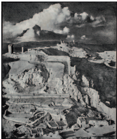
Fig. 7. José Ortiz Echagüe. Cerros de Calatayud (ca. 1935). Carbón directo sobre Papel Fresson. 36 x 34,5 cm.