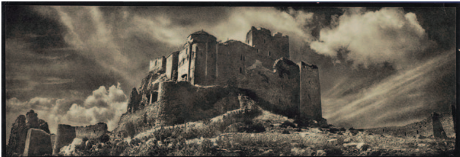
Fig. 6. José Ortiz Echagüe. Loarre, Huesca (ca. 1940). Carbón directo sobre Papel Fresson. 15,5 x 35,5 cm.