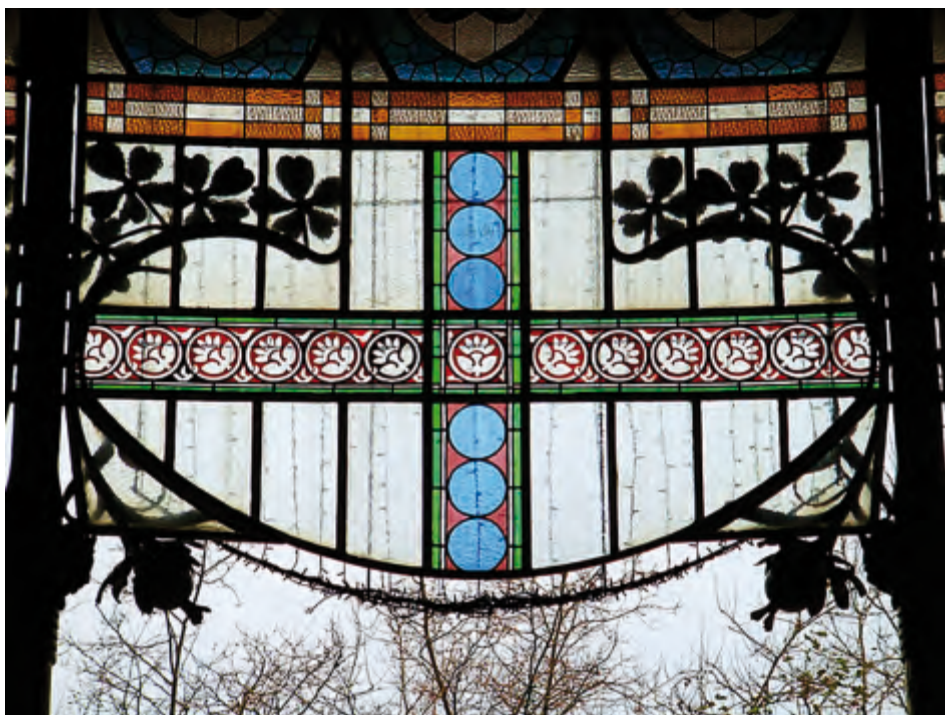
Figs. 1 y 1bis. Kiosco de la música en San Sebastián y detalle, 1907, por R. Magdalena y D. González.