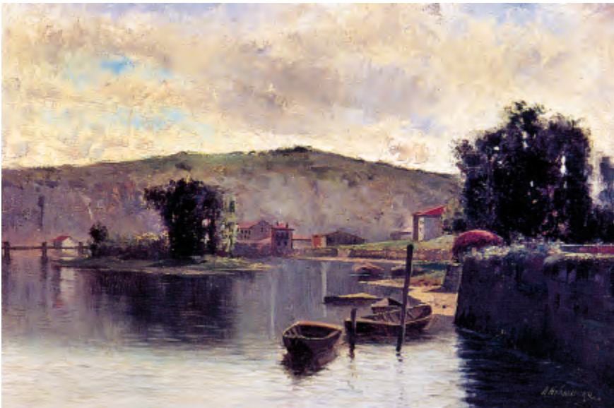
Fig. 12. Un paisaje parecido a éste del Bidasoa había presentado Aramburu a la Exposición Aragonesa de 1885 (Del catálogo Artistas Vascos en Roma).