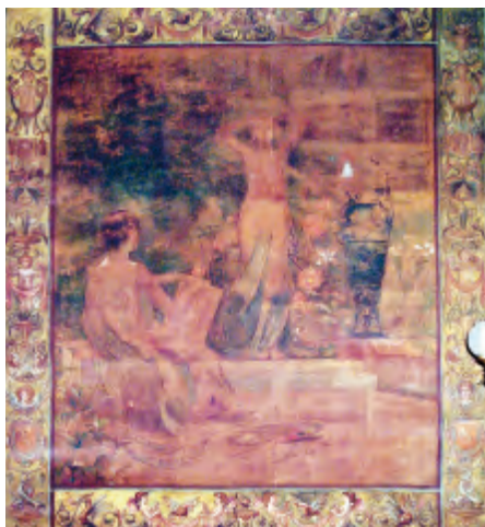
Fig. 7. Alegoría del Arte, 1889. Salón principal del antiguo Casino de Zaragoza.