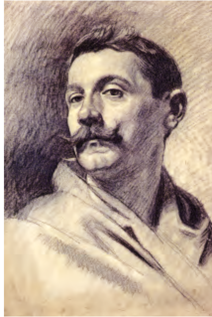
Fig. 11. Antonino Aramburu. Autorretrato a lápiz, ca. 1887 (Del catálogo de la exposición Artistas Vascos en Roma).