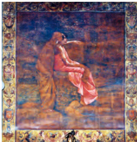
Fig. 8. Alegoría de la Inspiración, 1889. Salón principal del antiguo Casino de Zaragoza.

De los primeros, le encargaron a Marcelino de Unceta el de La pacificación de las Germanías de Valencia , que, según se comentó en el periódico como un alarde de maestría, lo pintó en veintisiete días, por el que cobró mil quinientas pesetas. Contaba 54 años y se hallaba en la cima de su popularidad. A Dionisio Lasuén le correspondió pintar el segundo tema de historia de Aragón sobre El Compromiso de Caspe , con los electores sentados tras una mesa, que junto con el de Unceta son los mayores.