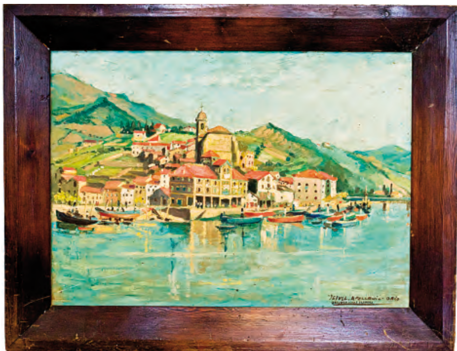
Fig. 6. Jesús Apellániz. Puerto de Orio: "Oriyoco ichas sarrera". Década de 1940 (o/l., 39 x 54 cm). Cruz Roja de Zaragoza.

Bilbao, años de prosperidad. Como es sabido, en esta capital se estaban construyendo al mismo tiempo y a poca distancia dos de los edificios más representativos de su modernizado urbanismo: el teatro Arriaga (inaugurado en 1890) y el ayuntamiento (dos años después), cada uno con su compacta decoración ecléctica. Dos años antes, a comienzos del verano de 1887, se había inaugurado en San Sebastián el Gran Casino en el más ortodoxo repertorio del estilo ecléctico francés para edificios de este uso.