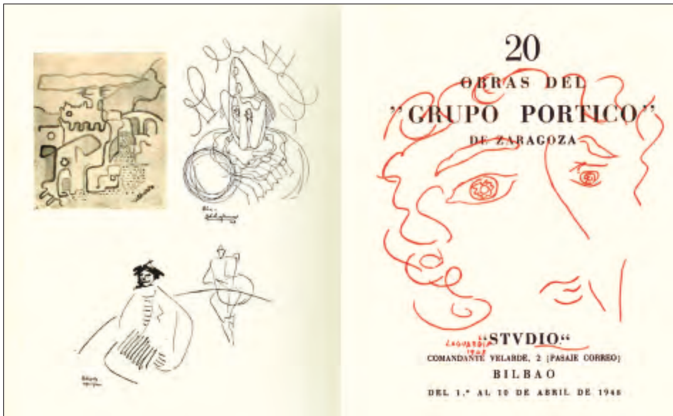
Fig. 4. Catálogo de la exposición de pintores del Grupo Pórtico en 1948. Dibujo de portada por E. G. Laguardia.