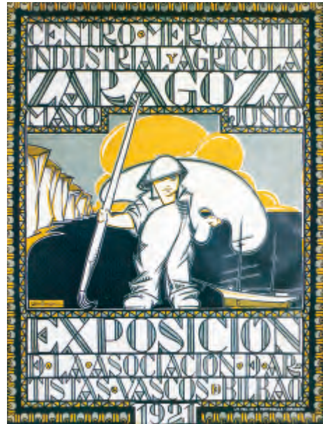
Fig. 3. Cartel de la Exposición de Artistas Vascos en Zaragoza, por A. de Guezala, 1921.

La obra, a pesar de su contenido de teatro existencial, que combinaba en escena la realidad y lo irreal y las angustias vitales de su autor, fue seguida con interés y hasta con emoción y muy bien recibida por la crítica.