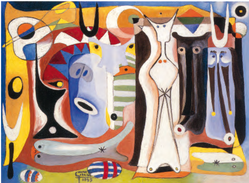
Fig. 5. Mariano Gaspar. Figuras, 1949 (o/l. 80 x 105 cm). Galería Guillermo de Osma. Perteneció a Willi Wakonigg, director de la sala Studio de Bilbao.