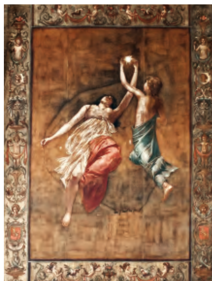
Fig. 9. Alegoría de la Electricidad, 1889. Salón principal del antiguo Casino de Zaragoza.

Se va a manifestar Antonino Aramburu un experto en alegorías. Representará en los tres lienzos que decoran a modo de tapices adheridos, las paredes del salón principal, las del Arte, de la Inspiración y de la Electricidad (292 x 210 cm cada uno) [figs. 7-9].