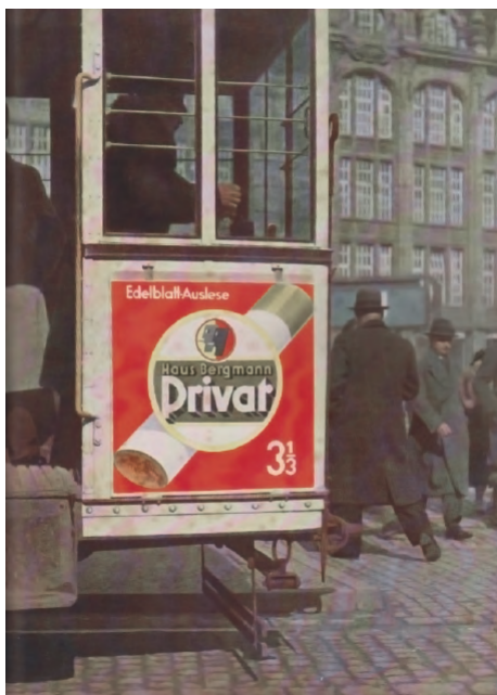
Fig. 1. Proyecto de cartel para tranvía. Berlín. Gebrauchsgraphik. International Advertising Art. Mai 1936.

las mismas personas) y sobre la que escribirán algunos teóricos ya desde fines del siglo XIX como el americano Elías St. Elmo Lewis (1872-1948) con su famoso Modelo AIDA (1898), referido a las estrategias para una buena comunicación. 11