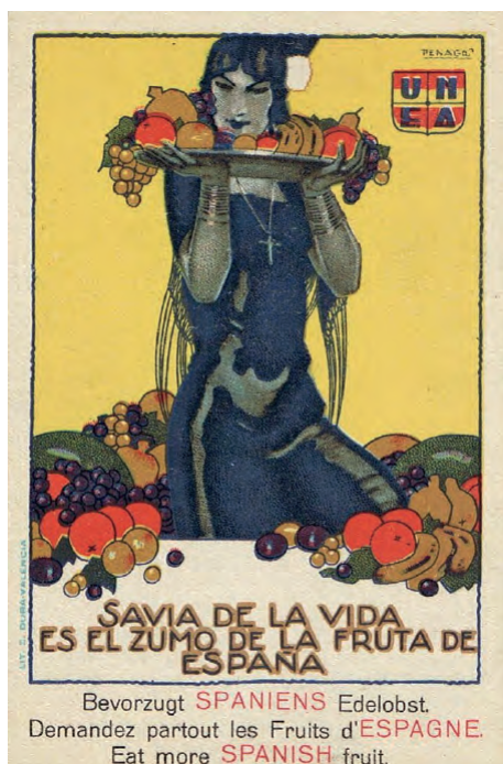
Fig. 11. Rafael de Penagos. Unión Nacional de Exportadores (1929).