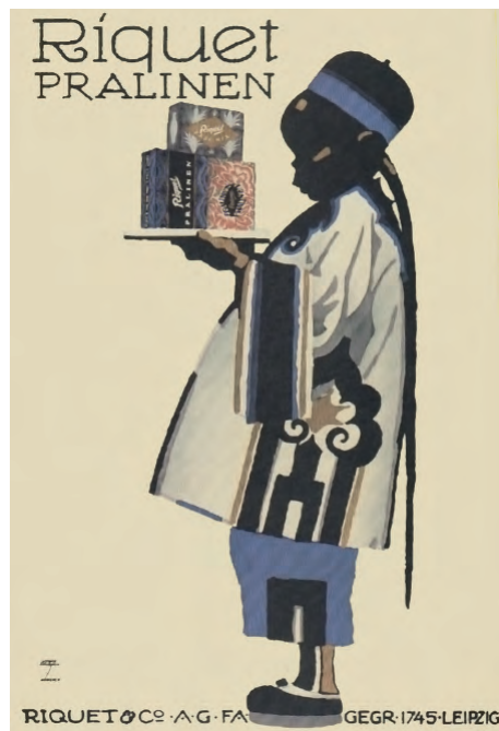
Fig. 6. Ludwig Hohlwein. Riquet/Pralinen (ca.1923).

de humor, caricatura y cierto ingenuismo. Mientras que en Polonia en los años cincuenta encontramos nuevamente un grupo de cartelistas con Jan Lenika (1928-2001) a la cabeza, de gran potencia expresiva sobre todo en carteles de cine. Mientras que el italiano Severo Pozzati (Sepo) (1895-1983) realizó numerosos carteles con un lenguaje de efectos ilusionistas y a veces burlescos. En Suiza habrá una actividad relevante de cartelismo publicitario y Raúl Eguizábal señala además la importancia de la fundación de la Alianza Gráfica Internacional el año 1950 que reunió a numerosos artistas y diseñadores gráficos de varios países intercambiando información a lo largo de los años. 30