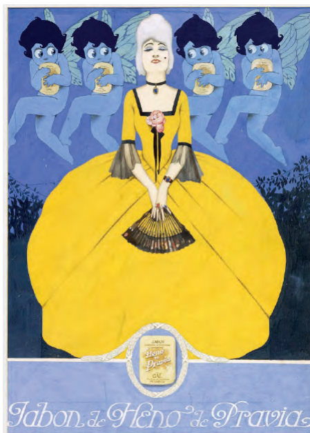
Fig. 9. Federico Ribas. Jabón Heno de Pravia. Primer premio del concurso convocado por la Casa Gal en 1916.