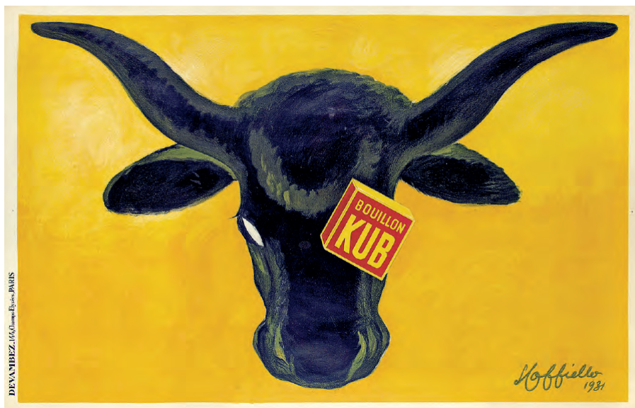
Fig. 4. Leonetto Cappiello (1931).