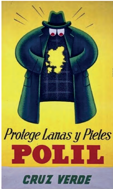
Fig. 16. Josep Artigas. Polil (1948).