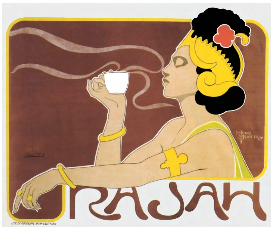
Fig. 3. Henri Meunier. Rajah (1897).