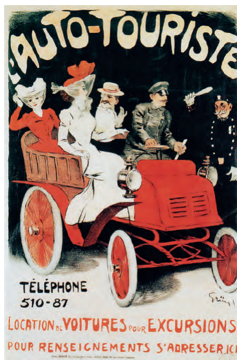
Fig. 2. Grün. L'auto-touriste (ca. 1900).

Charles Rennie Mackintosh (1868-1928) en Glasgow, y el estadounidense William Bradley (1868-1962). En Alemania Thomas Theodor Heine (1867-1948) además de autor de carteles fue dibujante de la revista Simplicissimus que influirá en distintos artistas como en el español Salvador Bartolozzi. Sin olvidar al italiano que vivía en París Leonetto Cappiello (1875-1942) a caballo entre el cartelismo francés y el italiano al trabajar para distintas marcas y a lo largo de las cuatro primeras décadas del siglo XX [fig. 4].