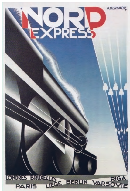
Fig. 5. A. M. Cassandre. Nord Express (1927).