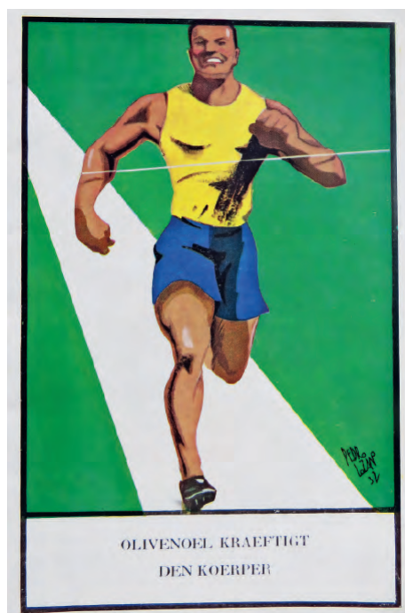
Fig. 12. Pedro Lozano de Sotés. Aceite de Oliva fortalece el cuerpo. Ministerio de Agricultura (1932).

de España, establecimientos y diversos acontecimientos, con muestras de numerosos carteles elaborados con buena calidad por autores que ya hemos nombrado y otros. Para la exposición Iberoamericana de Sevilla se celebrará en 1926 un concurso nacional de carteles que ganará Bacaristas siendo el suyo el cartel oficial. Pero para la propaganda conjunta de las de Sevilla y Barcelona se celebrará otro concurso de carteles el mismo año 1926 organizado por el consejo de Enlace, en los que el nombre será Exposición General Española (Sevilla, 1928, Barcelona, 1929) los cuales serán difundidos internacionalmente como carteles, portadas de folletos, tarjetas postales a la venta, sellos, etc. 53 En este caso el primer premio lo ganará Penagos y destaca por las figuras simbólicas y por el colorido, teniendo en cuenta que para determinado tipo de carteles de los años veinte y treinta utilizó figuras clasicistas y elementos que han