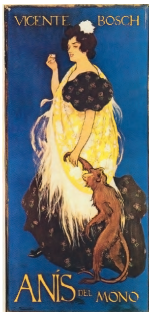
Fig. 8. Ramón Casas. Mono y mona, Primer premio del concurso convocado por Vicente Bosch (1898) para la marca Anís del Mono.