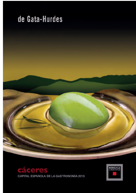
Fig. 17. Remedios Creativos. Cáceres Capital Española de la Gastronomía. De Gata-Hurdes (2015).

a menudo buscan la complicidad de la sonrisa como en el más famoso: Polil (1948) de la marca Cruz Verde [fig. 16], en línea con los del italiano Federico Seneca (1891- 1976). Así mismo Antonio Clavé (1913-2005) fue un innovador cartelista tanto en los años que precedieron a la guerra civil como después, sobre todo para el medio cinematográfico. Y Ricard Giralt Miracle (1911-1994), original autor de carteles, será importante sobre todo por su labor en el Institut d'Art Gràfic Filograf, que fundó en 1947.