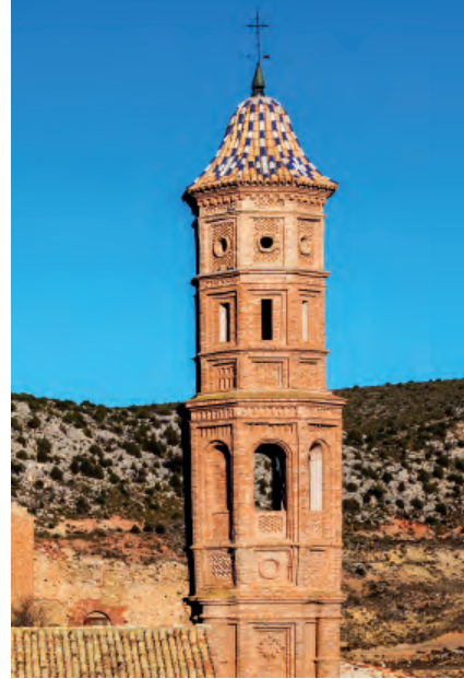
Fig. 6b. Torre de las Arcas (Teruel).