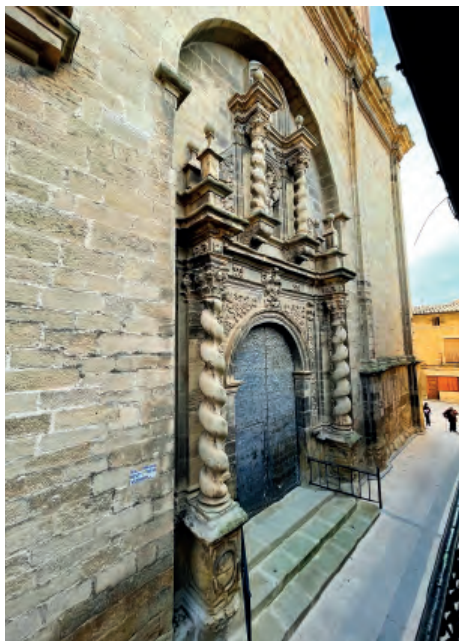
Fig. 4. Valdeatorrada (Teruel). Iglesia de la Natividad. Exterior. Portada.

Todos estos ejemplos son edificios de planta de cruz latina, con un módulo basilical de tres naves escalonadas, divididas en diferentes tramos de bóvedas de cañón con lunetos —las naves centrales— y de arista —las laterales—; con unos transeptos que no destacan en planta, en cuyas encrucijadas se elevan unas medias naranjas, que cuentan con unos tambores poco desarrollados, lo que no permite la apertura de vanos de iluminación, salvo en Villafeliche, y finalmente, todas cuentan con presbiterios poco profundos y cabeceras de perfil recto.