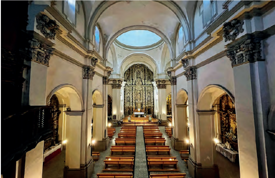
Fig. 3. Valdealgorfa (Teruel). Iglesia de la Natividad. Interior.

la que habitaba su esposa Teresa cuando su suegro ordenó sus últimas voluntades en enero de 1720. 37