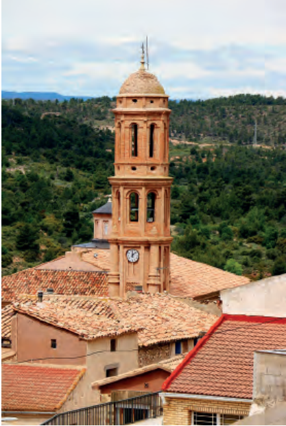
Fig. 6a. Crivillén (Teruel). Iglesia parroquial.