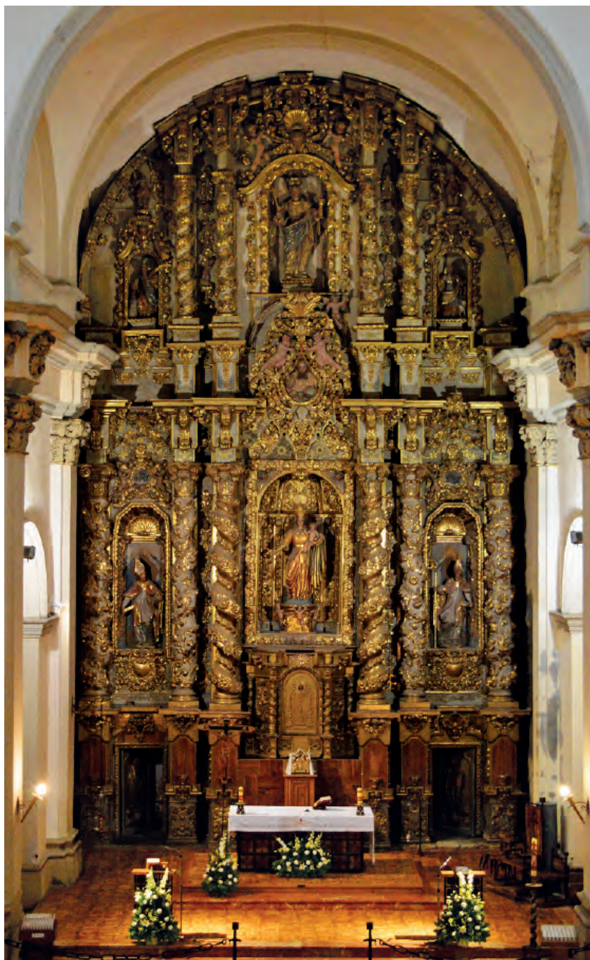
Fig. 7. Valdealgorfa (Teruel). Iglesia de la Natividad. Interior. Retablo mayor.