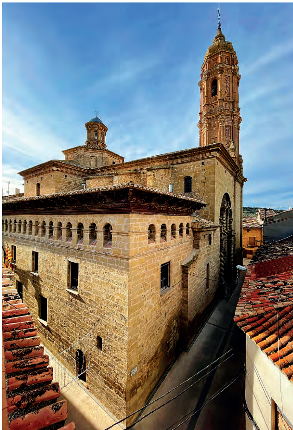
Fig. 2. Valdeatorza (Teruel). Iglesia de la Natividad. Exterior.