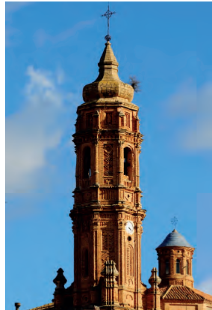
Fig. 6d. Valdealgorfa (Teruel).