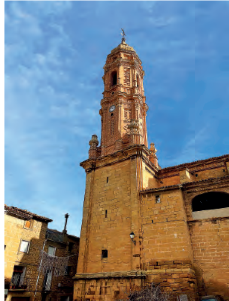
Fig. 5. Valdealgorfa (Teruel). Iglesia de la Natividad. Torre campanario.