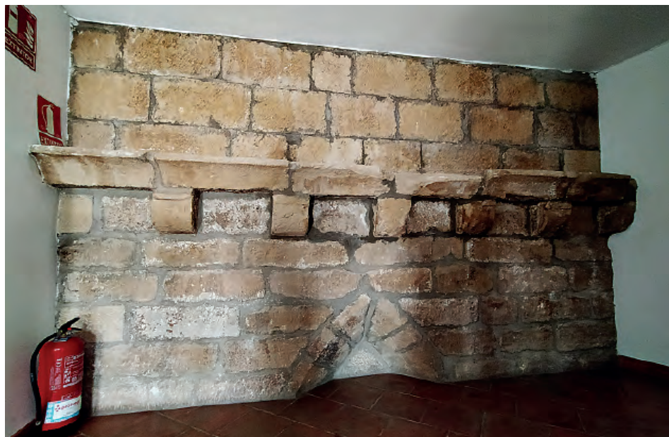
Fig. 1. Valdealgorfa (Teruel). Casa consistorial. Restos del antiguo templo medieval.

El mantenimiento de la fábrica de la iglesia dependía de los jurados de Alcañiz (Teruel), localidad a la que pertenecía administrativamente Valdealgorfa, quienes no invertían las cantidades necesarias para remediar todas las deficiencias que presentaba el templo, tal y como ponían de manifiesto los visitadores del arzobispado en las visitas pastorales giradas a mediados del Quinientos y a comienzos de la centuria siguiente. 3