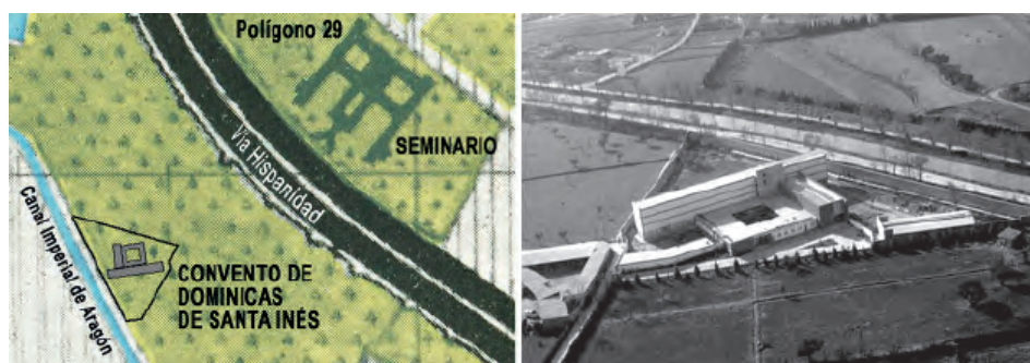
Fig. 1. Localización del convento: a la izquierda PGOU 1957, Hoja n.º 3 (sobrescrito), y a la derecha vista aérea del convento tras su construcción.

En 1959, las RR.MM. Dominicicas de Santa Inés comenzaron a plantearse la conveniencia de trasladarse a un lugar más apartado. Para ello vendieron parte de los terrenos del convento, aquellos comprendidos entre su límite occidental y las calles Boggiero, Cereros y paseo de María Agustín 7 y solicitaron licencia para la construcción de un nuevo convento al que se trasladaría la comunidad en 1965.