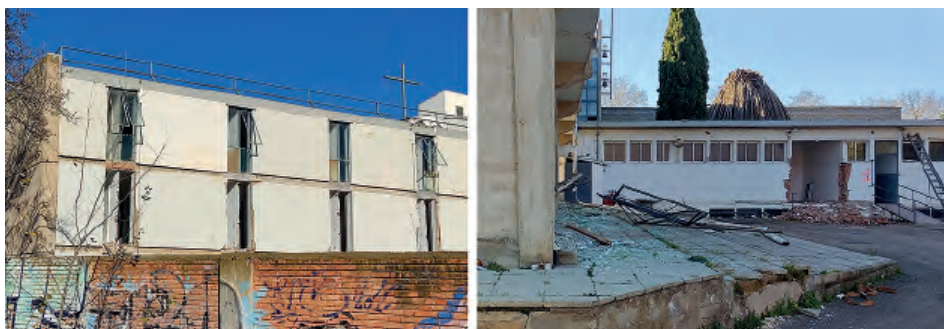
Fig. 4. Situación del convento tras el inicio de su derribo, a la izquierda fachada sur correspondiente a las celdas, y a la derecha fachada este correspondiente a la zona de cocina. I. Yeste, enero de 2022.

de Zaragoza decretó también la suspensión del derribo por no ajustarse a las condiciones de licencia . 18 Dos meses, ¿y entonces?