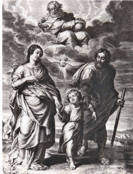
Fig. 7. Sagrada Familia. Estampa de Schelte a Bolswert sobre composición de Rubens.

fue afrontado exclusivamente por el gremio de los carpinteros, 27 que también se comprometió a proporcionarle sin coste alguno toda la madera para su ejecución [doc. 4]. Los acuerdos reflejados en este nuevo contrato no resultan demasiado descriptivos, dado que los comitentes impusieron como modelo otro rejado existente en aquellos momentos en la colegiata borjana, más específicamente en la capilla de mosén Gabriel Asensio, pero sí son suficientes para descartar que este encargo se corresponda con el actual rejado. El plazo de ejecución quedó acordado para el día de la Virgen del Rosario de ese mismo año y por un coste total de 320 sueldos jaqueses, abonados al artífice a partes iguales en dos plazos al comienzo y final de la obra [fig. 8].