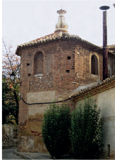
Fig. 3. Vista exterior de la capilla de San José desde la calle Claustrones.

la antigua capilla 19 que debería dejarla completamente lucida y acabada, contemplado la posibilidad de rematarla con una cúpula si, finalmente, la cofradía cedía un patio para ello [doc. 2]. 20 Las obras tenían que quedar acabadas el día de la Transfiguración de ese mismo año, bajo la multa de un escudo para Alonso de León por cada día que se retrasara. En el acuerdo, sin embargo, no se consigna el precio final de la obra, que sería tasada por dos peritos puestos por cada una de las partes, pero sí sabemos, en cambio, que la cofradía le proporcionó 10 libras jaquesas y 500 ladrillos con los que poder comenzar los trabajos, corriendo por su cuenta el gasto de los restantes materiales. Al parecer, los cofrades pretendieron ampliar