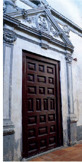
Fig. 9. Vista de la portada de acceso a la sacristía de San José.