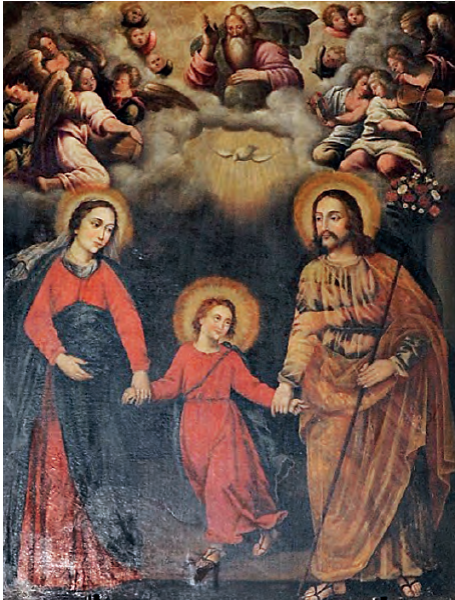
Fig. 6. Lienzo titular del retablo de la cofradía realizado por el pintor Jacinto Navarro Burena en 1642.