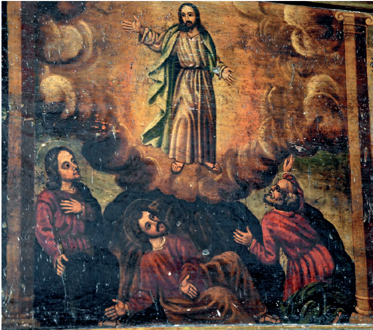
Fig. 5. Banco del retablo. Detalle de la escena central de la Transfiguración.