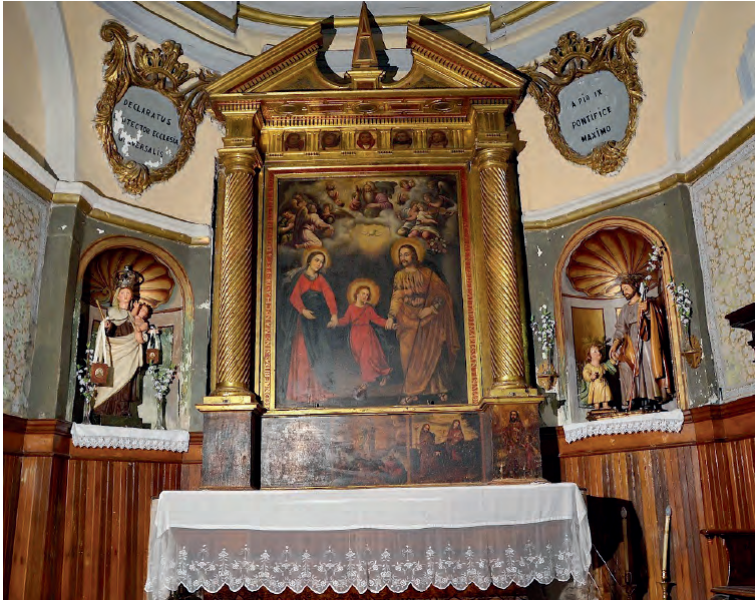
Fig. 4. Vista general del retablo titular de la capilla de San José.