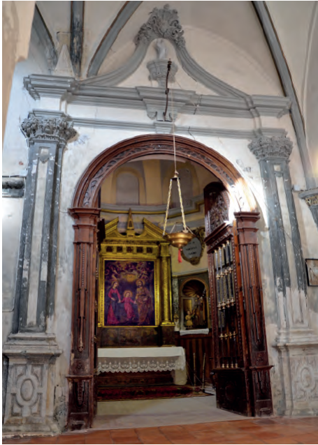
Fig. 2. Vista general de la portada de la capilla de San José en el claustro de la colegiata borjana.