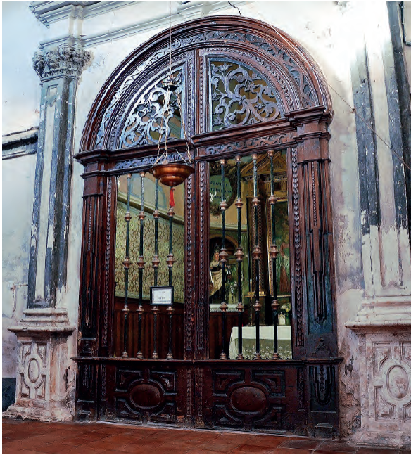
Fig. 8. Actual rejado de la capilla de San José.