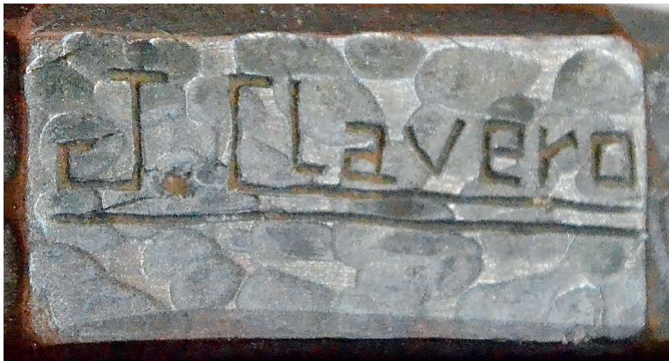
Fig. 8. Firma del escultor.