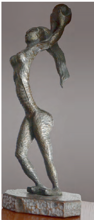
Fig. 6. Balarina, madera, 50x18x18 cm. Colección particular (Barcelona).