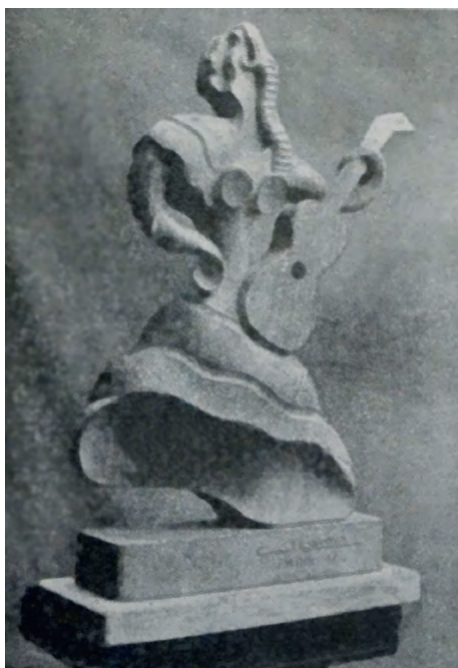
Fig. 4. La guitarrista, hacia 1947, madera. Paradero desconocido.

Fig. 5. Detalle de Solidaridad Obrera , nº 115 (París, 19-IV-1947) donde podemos ver reproducidas algunas obras expuestas en la muestra Art espagnol en exil , como el hermoso lienzo Exodo , de Miguel Tusquellas; El brujo enamorado de Daniel Sabater; y las similitudes existentes entre la Danzarina en madera de Clavero y El mártir en hierro de Blasco Ferrer.