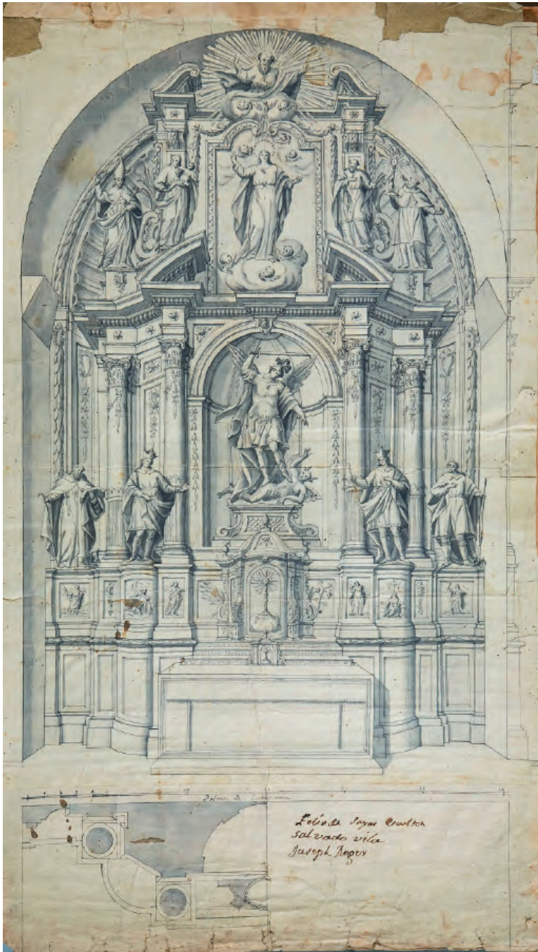
Fig. 3. Félix de Sayas, Retablo de San Miguel, sin fecha, Gabinete de Dibujos y Grabados del Museu Nacional d'Art de Catalunya.