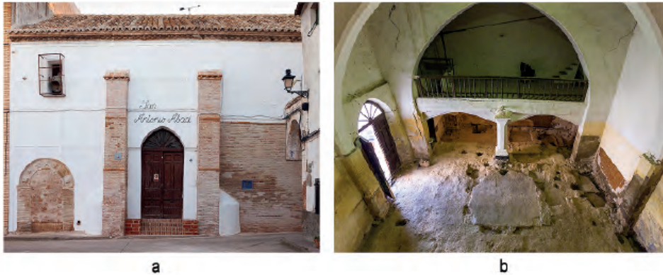
Fig. 1. Iglesia de San Antonio Abad / antigua sinagoga de Híjar. 1.a. Fachada. Fotografía: Cristina Bazán Sánchez). 1.b. Interior durante la excavación arqueológica en 2017, con la subestructura de la tevá. Fotografía: Diaporama Pro.

de la Biblia. La documentación medieval aragonesa la denomina theva , como se puede reconocer en la licencia real para construir la sinagoga de Albarraçin: construere in altum tevam cum ejus scala . 10 Los restos conservados en Híjar corresponden a la base del púlpito, un pavimento de argamasa de planta cuadrada dotado de una potente estructura de cimentación, incluso con zapatas en las esquinas para soportar las pilastras de la tarima superior. La estructura se completa con el arranque de dos escalerillas de madera por las que se accedería a dicha tarima. 11