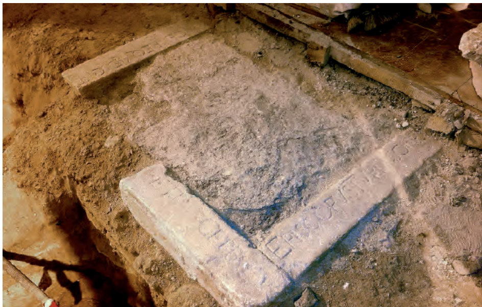
Fig. 3. Calatayud. Santa María. Detalle del perfil inferior del sepulcro de Pedro Cerbuna en noviembre de 2011.