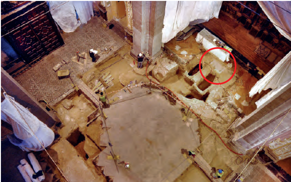
Fig. 2. Calatayud. Santa María. Vista de las prospecciones arqueológicas en el presbiterio del templo en noviembre de 2011, con el perfil inferior del sepulcro de Pedro Cerbuna.