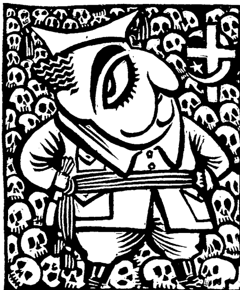
Miguel Covarrubias: Franco. 1948. 12 × 14 cm.

Tras el estallido de la Segunda Guerra Mundial, el TGP se entrega a una actividad acelerada: ilustraciones para la prensa antifascista, telones para mítines y exposiciones gráficas contra el terror nazi-fascista. Bajo el lema «El frente soviético es nuestra primera línea de defensa» se acomete una campaña de carteles pro soviéticos, tanto en la capital como fuera de ella, y para cubrir los gastos de cada tirada, dícese de 5.000 carteles, se hace un sobretiraje de 200 ejemplares, impresos en papel de alta calidad, que se venden a los simpatizantes del TGP. Para el Libro Negro del