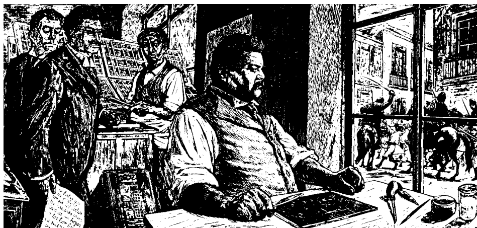
Leopoldo Méndez: Homenaje a Posada. 1953. Linóleo. 36,2 × 78,5 cm.