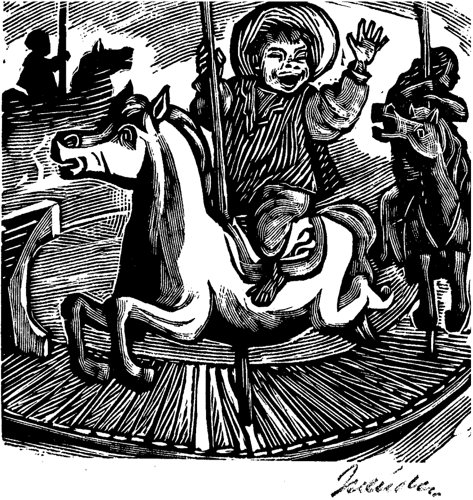
Leopoldo Méndez: El carrusel. 1947. Linóleo. Col. del autor.

de talante muy agresivo. Además ya no se volvieron a editar portafolios. Adquieren protagonismo los nombres de Elizabeth Catlett y Adolfo Quinteros, y después de la expulsión de este último, en 1968, no surgieron obras de calidad. Sólo Ángel Bracho supo mantener su nivel. Más tarde, la llegada de numerosos artistas jóvenes provocó que la obra del Taller fuera tan diversa que resulta imposible darle una clasificación estilística 82 .