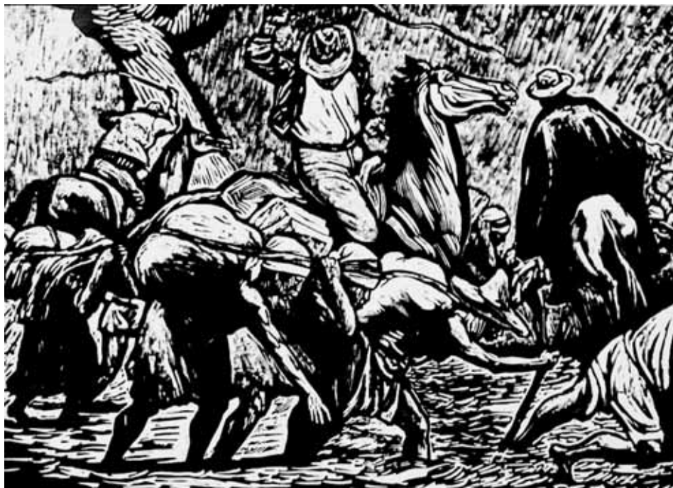
Leopoldo Méndez: Los esclavos. 1954. Linóleo.

puede calificar —como apunta Justino Fernández— como la más interesante del grabado mexicano del siglo pasado 44 . Pasó el tiempo y, en 1952, Leopoldo Méndez recibía el Premio Internacional de la Paz, concedido por la entonces poderosa Unión Soviética. Méndez no lo dudó y entregó el efectivo del premio al TGP. También en aquella década, 1957, tuvo lugar la exposición «Vida y drama de México». Dicha exposición, que se celebró en el Palacio de Bellas Artes, resumía veinte años del grupo y en ella expusieron treinta y tres miembros del mismo; y tiempo después, 1966, en el mismo Palacio de Bellas Artes, tuvo lugar también la exposición: «Treinta años del TGP» 45 .