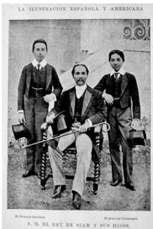
Fig. 3. «S.M. el Rey de Siam y sus hijos», La Ilustración Española y Americana, 8 de julio de 1897.