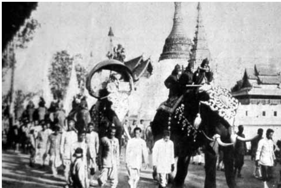
Fig. 6. Fotografía de la comitiva de ochenta y cuatro elefantes que ilustró el reportaje «La primera visita del Rey de Siam a las provincias del norte en su reinado», Mundo Gráfico, 31 de agosto de 1927.