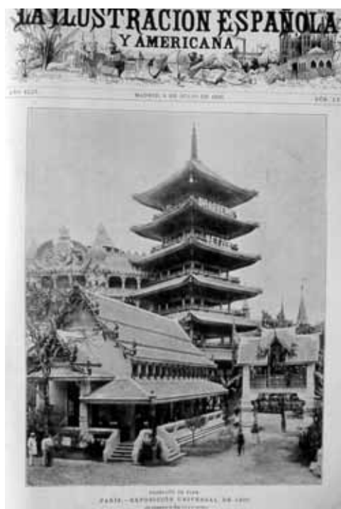
Fig. 4. «Pabellón de Siam. París, Exposición Universal de 1900», La Ilustración Española y Americana, 8 de julio de 1900.