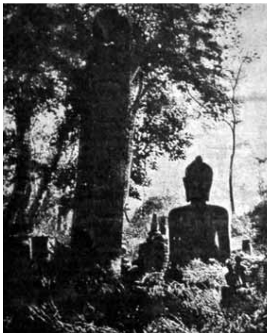
Fig. 7. Fotografía de una «figura sedente de Buda en las ruinas de un antiguo templo» que ilustró el reportaje «Restos de una antigua civilización», Alrededor del Mundo, 6 de febrero de 1926.