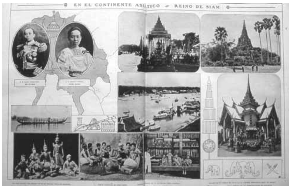
Fig. 5. Reportaje gráfico de Trampus «En el continente asiático: Reino de Siam», La Ilustración Española y Americana, 22 de julio de 1914.