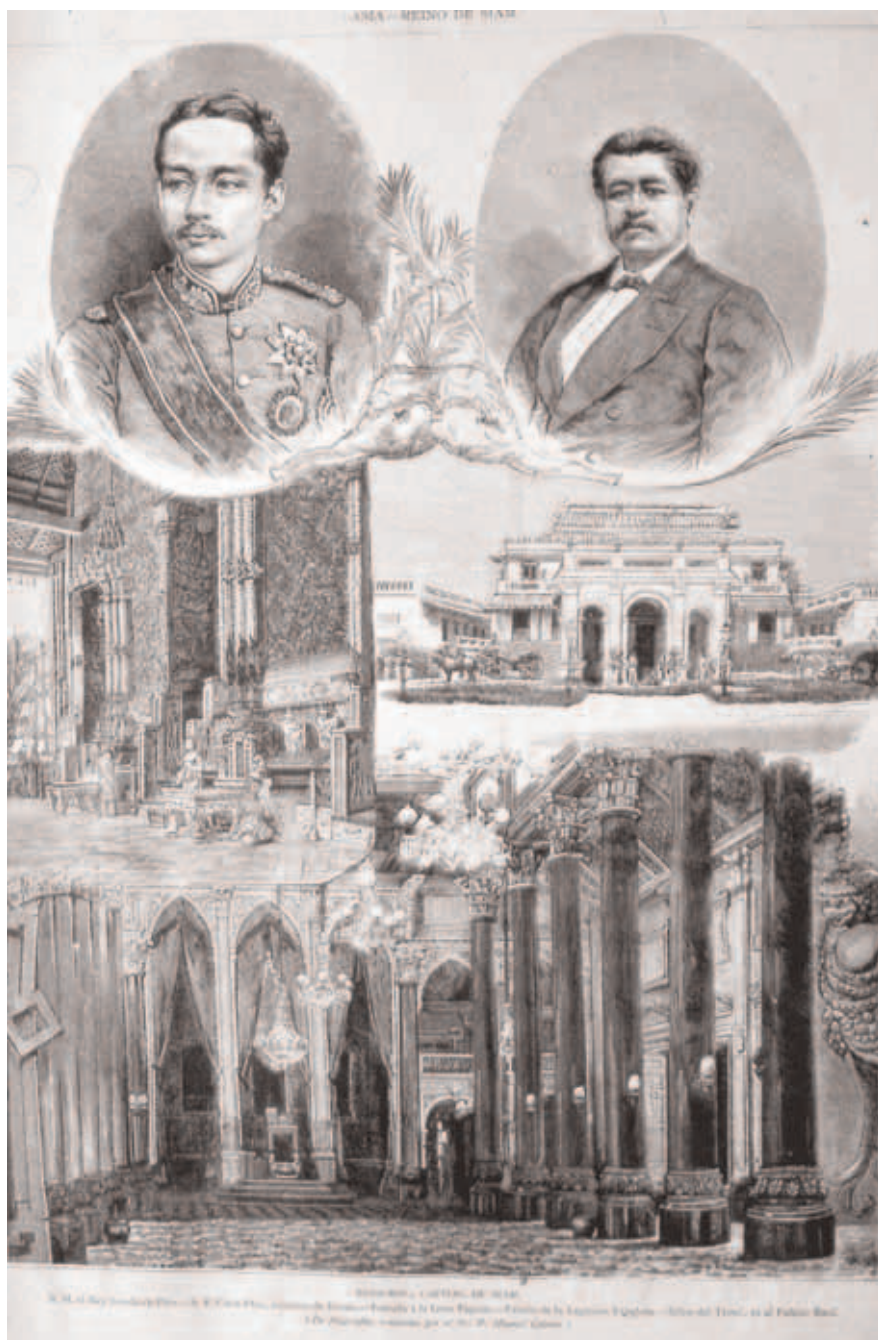
Fig. 1. Ilustraciones del artículo «Bang-Koc, capital del reino de Siam», de Manuel Boch, xilografías de Capuz a partir de fotografías remitidas Manuel Cotoner, La Ilustración Española y Americana, de 8 de junio de 1880.