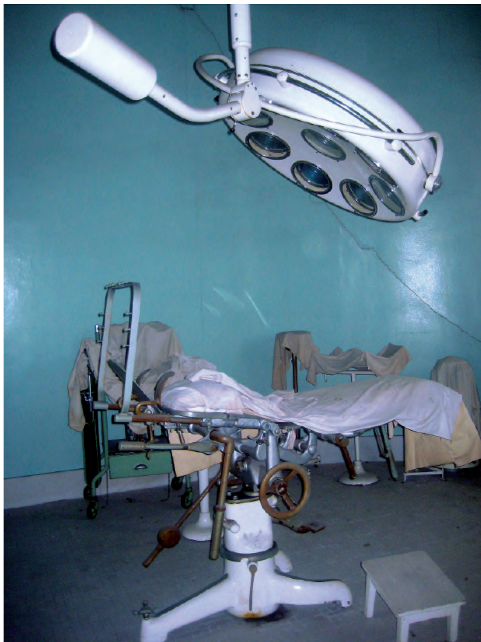
Fig. 3. Quirófano del Sanatorio del doctor Lozano, todo un testimonio para la historia de la Medicina. Estado de conservación en 2014.