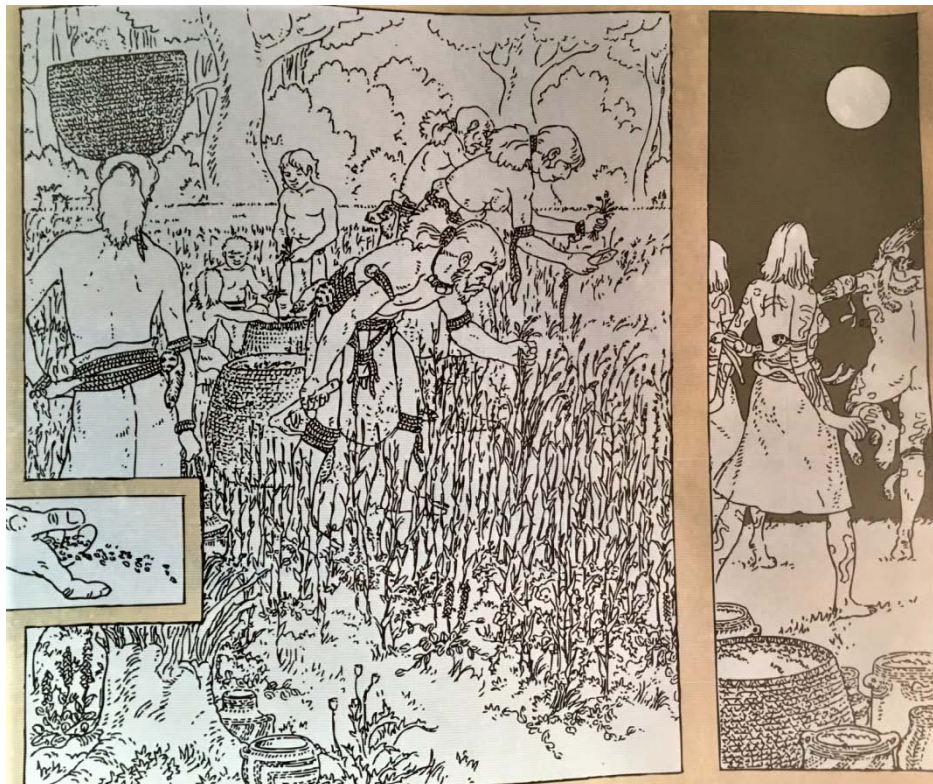
Figura 5: detalle de la escena de la recolección y la danza.

En cuanto al lenguaje escrito, en la exposición, se utiliza el masculino genérico para referirse a la sociedad en plural y cuando aparece la palabra “hombre” va acompañada de mujer. Aparece cuatro veces, “los hombres y las mujeres”.