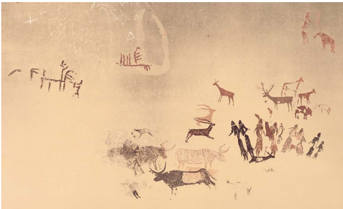
Figura 1:calco de la Roca de los Moros propiedad de la Generalitat de Catalunya (1986-1987).

Esta investigación que se presenta se llevó a cabo en el conjunto de arte rupestre de la Roca de los Moros del Cogul (Les Garrigues, Lleida) con la construcción de un nuevo programa de actividades educativas para el centro de interpretación que, en 2015, reabría las puertas a las visitas y a los centros educativos. Las pinturas levantinas del Cogul, concretamente la escena principal que se representa en el abrigo, son un referente universal que las personas visitantes y el alumnado, tienen integrado en su memoria subconsciente cuando llegan al centro de interpretación. En esta escena de la roca aparece un conjunto de mujeres representadas de dos en dos y un hombre más pequeño, desnudo, en el medio. Es la imagen más difundida del arte levantino de la cuenca del Mediterráneo, la que sale como ejemplo en muchos los libros de texto y otras publicaciones didácticas sobre arte levantino (figura 1).