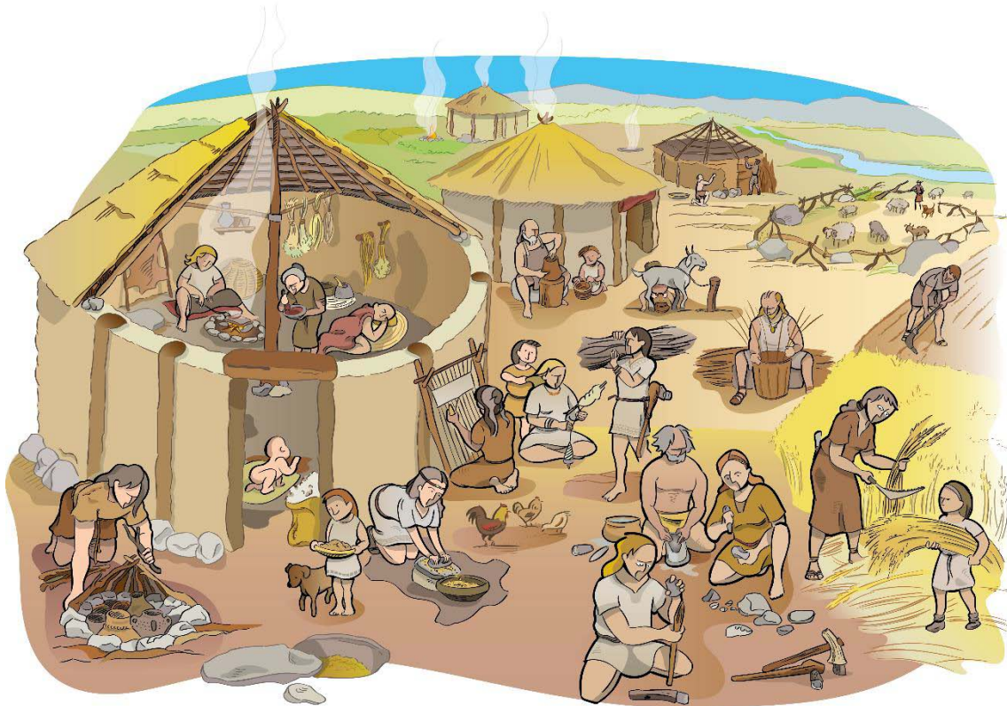
Figura 2: ilustración de un asentamiento neolítico.

integrada, ocupándose de plasmar también, a mujeres, niñas, niños, personas mayores y enfermas, compartiendo protagonismo y trabajos (figura 2).