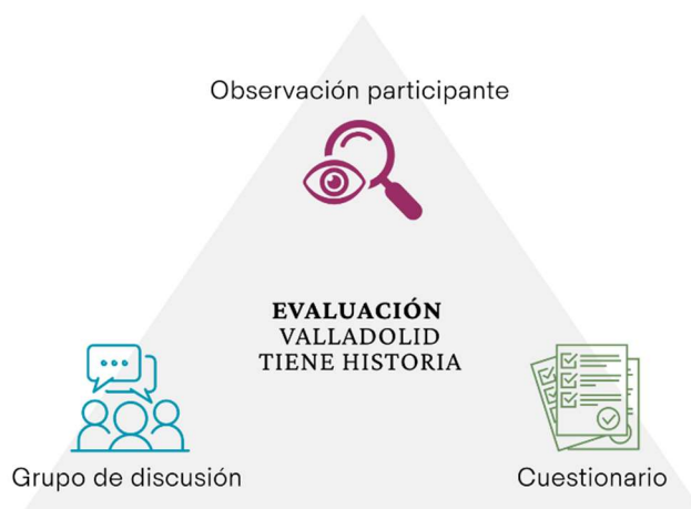
Fig. 3. Triangulación de la información recogida.

En base a este requerimiento, la recogida y triangulación de información mediante tres técnicas diferentes se presenta como la estrategia de evaluación más adecuada (Figura 3), permitiendo obtener una visión integral del desarrollo, el impacto y los resultados del evento desde los discursos de los organizadores. Las herramientas empleadas han sido el cuestionario, el grupo de discusión y la observación participante, aplicadas a los miembros de la ACH Torre del Homenaje , quienes constituyen la muestra de este estudio (N=22) en calidad de organizadores del evento, por lo que los hallazgos reflejarán únicamente sus perspectivas y no son representativos de la ciudadanía en general.