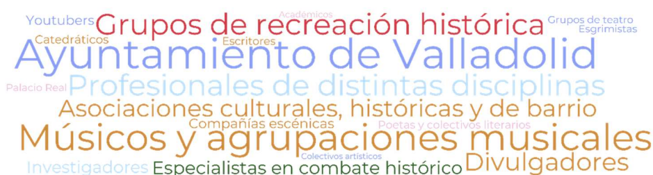
Fig. 2. Red de Colaboradores.

La red de colaboradores que hizo posible Valladolid Tiene Historia fue tan diversa como enriquecedora. Se contó como institución principal con el respaldo del Ayuntamiento de Valladolid y del Palacio Real. Del mismo modo, también con asociaciones culturales, históricas y de barrio; grupos de teatro y compañías escénicas; músicos y agrupaciones musicales; poetas y colectivos literarios; divulgadores, youtubers, investigadores y colectivos artísticos; así como grupos de recreación histórica, esgrimistas y especialistas en combate histórico. A ello se sumaron asesores, académicos, catedráticos, escritores y profesionales de distintas disciplinas, cuya implicación consolidó una red interdisciplinar comprometida con el patrimonio y la memoria colectiva (Figura 2).