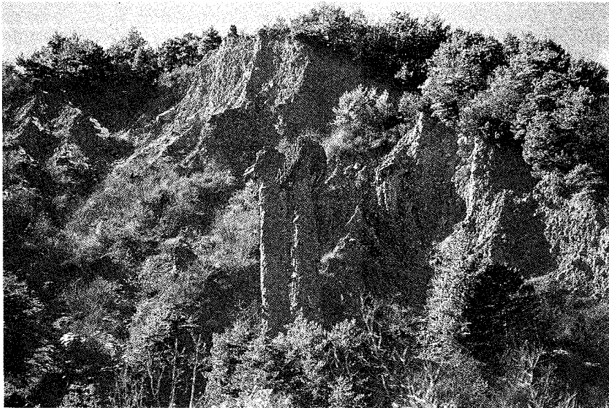
Fot. 1.- Vista general de las "Señoritas de Arás", modeladas sobre un depósito complejo de materiales morrénicos y de ladera.