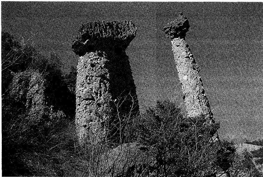
Fot. 2.- Detalle de las "Señoritas de Arás" que pone en evidencia su avanzado grado de evolución.