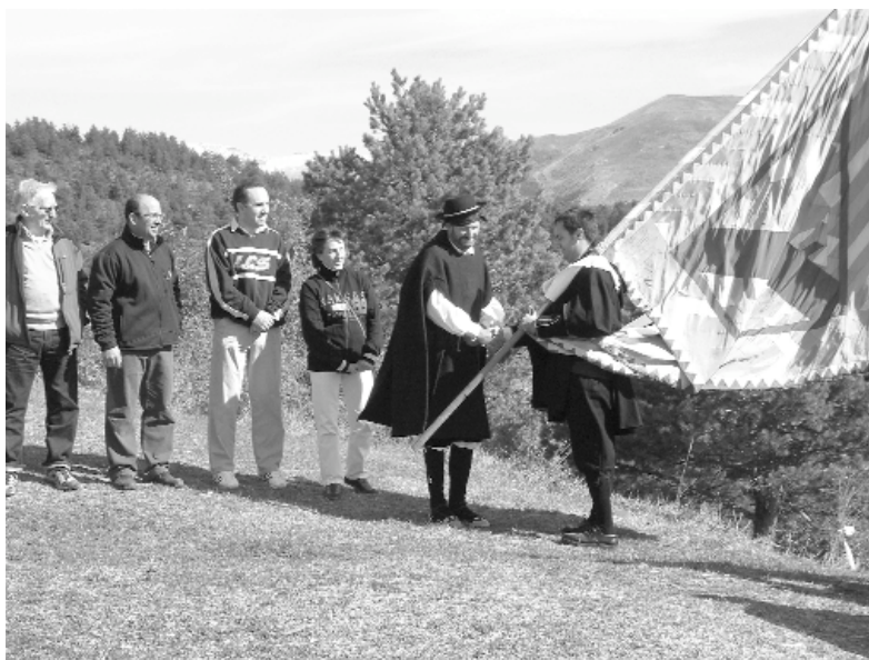
Foto 1. Encuentro de representantes de ambos valles en los llanos de Puyeta.

Además de la cada vez mayor participación en las fiestas patronales 7 los programas orientados al desarrollo e incluso a la ordenación territorial se están impulsando con efectividad. Tanto la rememoración de acontecimientos históricos como el Tratado de las tres vacas y sobre todo 8 el de la Junta de San Miguel favorecen el impulso de programas de fomento coordinados.