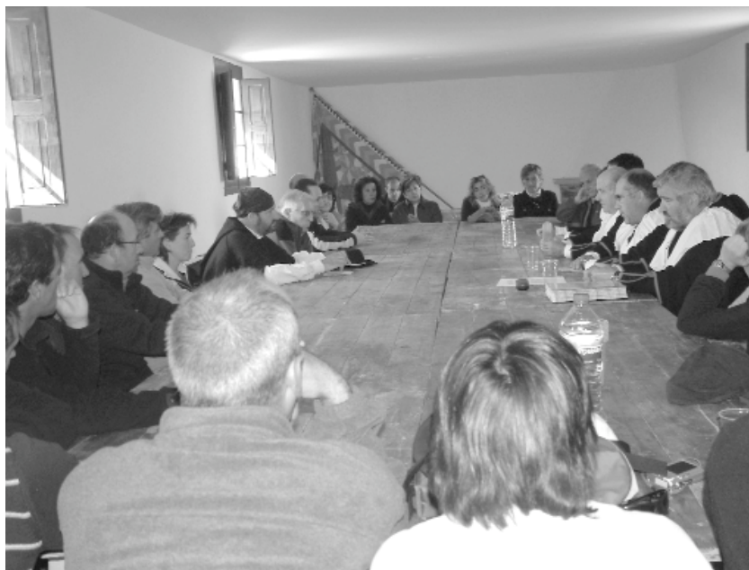
Foto 2. Sesión de debate en la Junta de Puyeta.

utilizarán árboles maduros, sino aquellos con un diámetro inferior a 40 ó 50 cm, pero no debemos olvidar que estos árboles jóvenes son los que deben regenerar el bosque, luego hay que hacer una ordenación muy precisa. Habrá que pensar en la plantación de cultivos energéticos, especies forestales de crecimiento rápido, creación de viveros para los plántones de cultivos energéticos... Es decir, se abren nuevas expectativas pero que requieren minuciosos estudios, planes y gestión supramunicipal, pues, en principio, parece difícil un total abastecimiento de materia prima en cada valle.