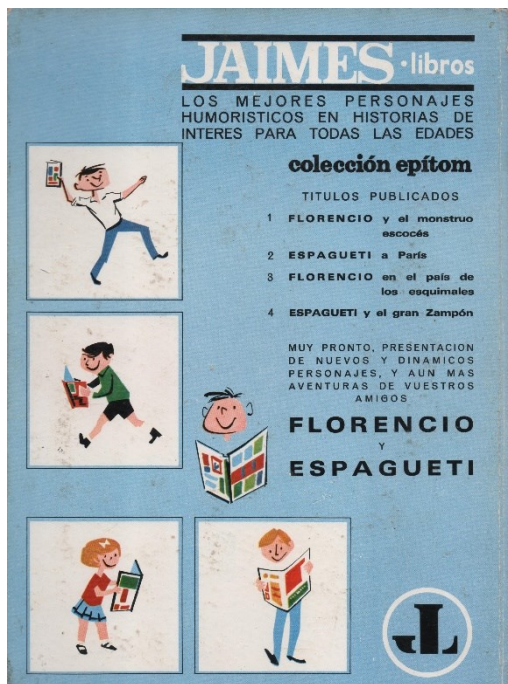
Fig. 2. Contraportada de Espaguetti y el gran Zampón (1967)

francés René Goscinny y del dibujante belga Berck (Arthur Berckmans), que narraba, en clave de humor, las aventuras de un taxista que siempre encuentra una excusa para viajar a lugares exóticos. Como las aventuras originales solo tenían 30 páginas, Jaimes Libros ofrecía dos historietas en cada uno de sus volúmenes. En Bélgica se publicó hasta 1968, si bien Goscinny fue substituido por Acar (Jacques Acar) a partir de 1965. 30 Espaguetti ( Spaghetti ) era otra creación (1957) de Goscinny, en esta ocasión en colaboración con el dibujante Dino Attanasio, conocido por su participación en la creación del personaje realista Bob Morane.