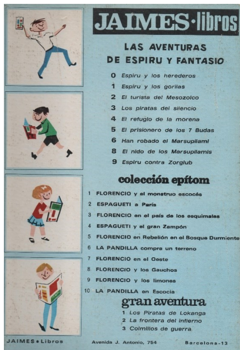
Fig. 1. Contraportada de El nido de los marsupilamis (1969)

versión en lengua castellana, no se acreditaba al traductor. De este volumen nos consta que cierto número de ejemplares constituyeron un «obsequio de la Caja de Ahorros Provincial de Gerona para conmemorar la Fiesta del Libro». 25 Por cierto que en la contraportada, aparece un listado de Las Aventuras de Espirú y Fantasio del que ha desaparecido el número 7, al cual nos hemos referido anteriormente [fig. 1]. Los últimos números de esta colección fueron Espirú contra Zorglub (1970), El retorno de Z (1972) y Espirú en África (1973). Su publicación original en forma de álbum databa de 1961, 1962 y 1955. Tenemos que hacer notar que el título original de Espirú en África era muy diferente, La Corne de rhinocéros .