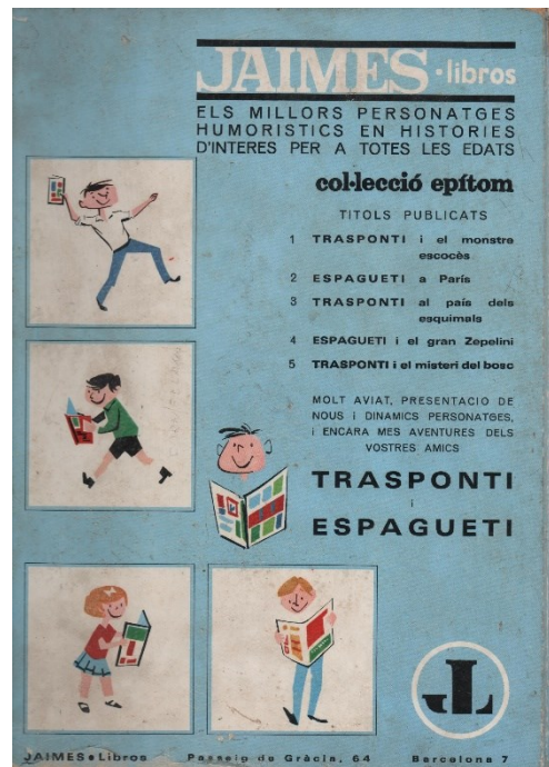
Fig. 3. Contraportada de Traspontí i el misteri del bosc (1968)