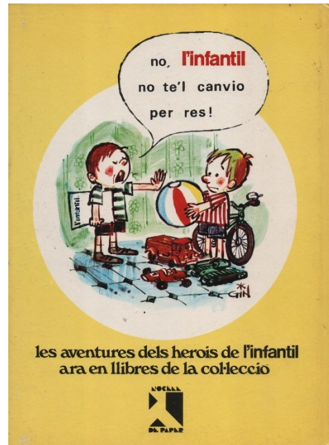
Fig. 5. Contraportada de Clifton i els follets endiastrats (1970)

En conjunto, estas colecciones ofrecieron al mercado de habla catalana una decena de volúmenes, con personajes realistas como Howard Flynn y Los Franval o humorísticos como Clorofila o Umpah-Pap. Asimismo, también incluyeron dos episodios de Espirú y otros dos de Lidia ( Line ), una de las pocas series franco-belgas de la época con una protagonista femenina. Se trataba de una creación (1955) de Françoise Bertier i Nicolas Goujon, que fue continuada en los años sesenta por Paul Cuvelier y Greg. En cuanto a la tirada, era la habitual en los álbumes en lengua catalana. Así, de El primer viatge del tinent Howard Flynn (abril 1970), se imprimieron 3.000 ejemplares, con un precio de venta de 75 pesetas. 46