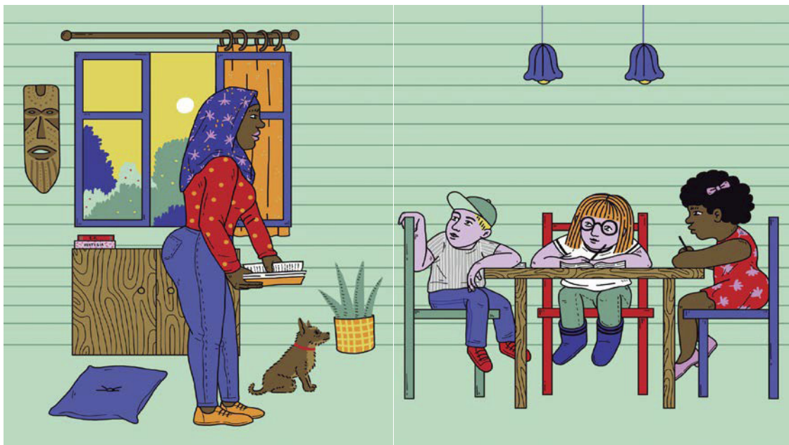
Fig. 6. Ainara Azpiazu. Arraroa . Pamiela, Pamplona, 2017.

Pero tal vez lo más llamativo, en cuanto a equiparación o igual entre géneros, lo apreciemos mejor en aquellas obras que además de dicha equiparación buscan romper con todo tipo de estereotipos (Fig. 6).