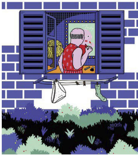
Fig. 7. Aina Azpiazu. Arraroa . Pamiela, Pamplona, 2017.

Dicen García Villanueva y Hernández Ramírez (2016, p. 94) que «Los hombres y las mujeres no llegan al mundo programados para ser o actuar de una determinada manera, desarrollan capacidades según las condiciones y oportunidades que el medio les ofrezca.» En este sentido, creemos que es clave la labor de la LIJ para crear determinadas condiciones y oportunidades, para ofrecer una nueva visión del hombre y de la mujer actual, para contribuir al cambio de la sociedad en pos de una sociedad más igualitaria (Fig. 7).