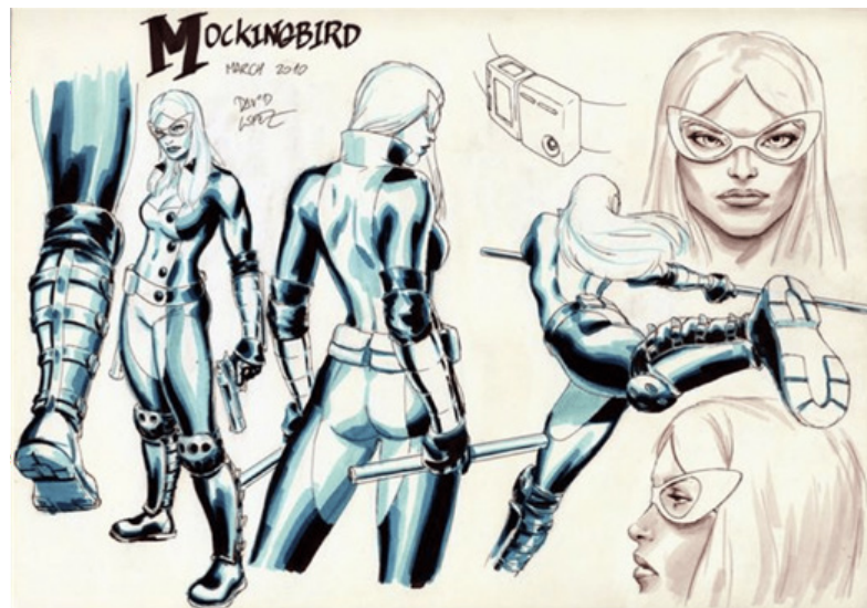
5. Nuevo diseño del traje de Mockingbird para Marvel Comics

de Mockingbird, se trataba nada menos que una agente secreto supercientífica, y el vestuario que llevaba hasta el momento no se correspondía en absoluto con este perfil. Lo rediseñé pensando en qué se hubiera puesto realmente, buscando la comodidad de movimiento y la protección, además de dotarlo de una alta tecnología, que es lo propio para una mujer como ella. Traerla a La Aljafería fue un capricho personal que entusiasmó al equipo, les pareció sin duda el lugar idóneo, más que exótico desde el punto de vista estadounidense.