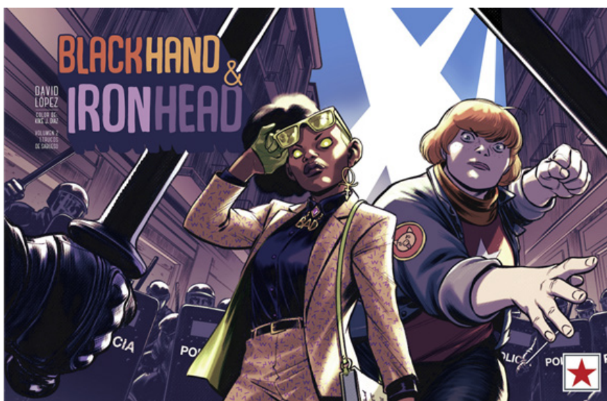
7. Portada de la primera entrega del segundo volumen de Black Hand & Iron Head

Una buena obra juvenil, o con protagonistas en esa franja de edad, puede ser apreciada por un niño, por un joven o por un adulto, solo que sus niveles de comprensión irán cambiando según lo hace su percepción del mundo. Si un libro posee esas diferentes puertas de entrada, invitará siempre a su relectura por mucho tiempo que pase.