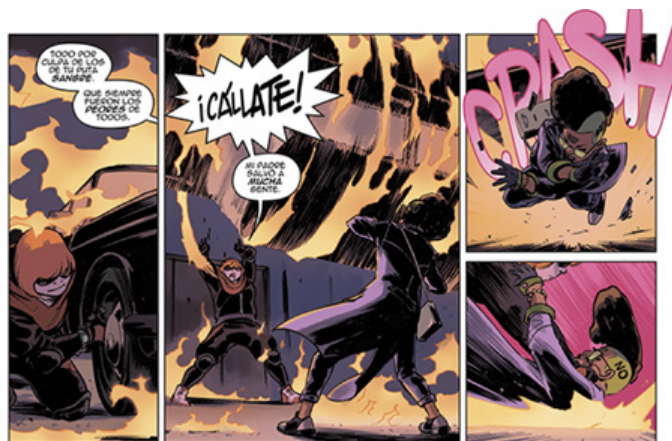
3. Alexia, dotada de superfuerza, lucha contra su hermana

A Amy le sucede que, después de la efervescencia inicial, de vivir su revolución personal contra el sistema, se da cuenta de que poco puede hacer contra dicho statu quo luchando sola.