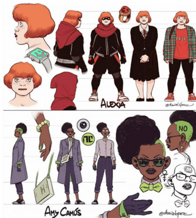
2. Diseño de los personajes protagonistas de Black Hand Iron Head

Me concentré en que no se parecieran y, cuando las presenté, el público consideró que había apostado por la superación de estereotipos y por la integración racial, cuando no era realmente en lo que estaba pensando cuando las creaba, pero salió así y salió bien. Siempre prefiero fiarme de mi intuición, que a veces sabe más que mi cerebro consciente. Supongo que, en definitiva, los personajes están diseñados en función de lo que pide la historia: Amy es una chica negra y hay muchos prejuicios contra ella por ser hija de una conocida supervillana, la terrible Mano Negra; Alexia es pelirroja y pecosa y su padre, el gran Iron Head, se lo echa en cara y le sugiere teñirse, además de decirle que tiene que adelgazar, y todos estos conflictos personales sirven al relato que estoy contando, para mostrar que el padre no entiende quién es su hija realmente, sino que quiere construir una persona según cómo se imagina que tendrían que ser las cosas. Subyace a todo un tremendo drama familiar, lleno de engaños y mentiras.