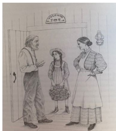
Imagen 2. El señor Cuthbert.

En relación con la representación del padre de Minna y las conexiones con Matthew, se refieren