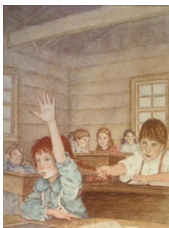
Imagen 4. Incidente en la escuela en The Rag Coat .

En relación con las imágenes y textos que el álbum y la novela muestran para referirse al contexto escolar, se encuentran numerosos paralelismos. En el álbum, Minna aparece en su pupitre bastante concentrada en su trabajo y levantando la mano mientras que un niño en el pupitre trasero le tira de su trenza roja y otros jóvenes cuchichean a sus espaldas. Así se muestra en la imagen 4: