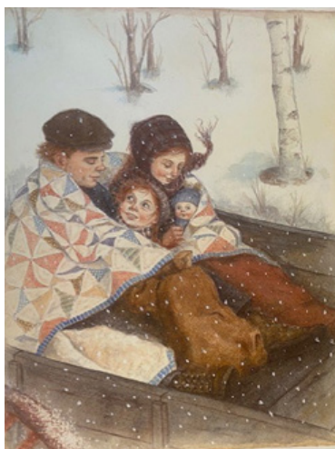
Imagen 3. Familia en el carruaje.

tres ilustraciones del álbum. En la primera de ellas, este aparece en un carruaje (véase imagen 3), al igual que el señor Cuthbert cuando se dirige a buscar a Ana a la estación (Montgomery, 1989, p.19).