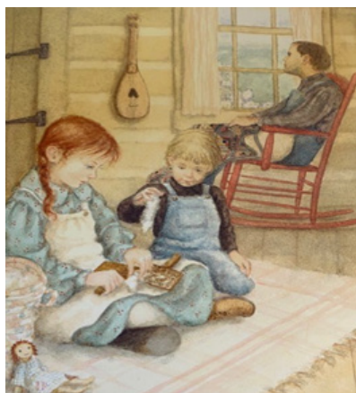
Imagen 1. Padre de Minna.

Si exploramos las coincidencias y diferencias entre ambas obras en lo que se refiere a la estructura familiar, se puede observar que Minna, la protagonista del álbum, sí tiene padre biológico, aunque su fallecimiento acontece en las primeras páginas, mientras que Ana es adoptada por los hermanos Cuthbert para ayudarles en su granja. Sin embargo, Matthew Cuthbert asumirá las funciones de padre para Ana a lo largo de toda la novela. Con independencia de la vinculación biológica o carácter adoptivo de las figuras paternas y del período en el que se desempeñarán estas funciones en cada obra, ambos protagonistas comparten determinadas características, mostrándose, a modo de ejemplo, bastante afectivos y cariñosos. Esta afectividad podría ser más propia de las figuras maternas en un entorno rural donde los padres de familia se encuentran enteramente dedicados al trabajo y sus ocupaciones, sin embargo, coincide con las conclusiones del estudio de Frank (1998) sobre masculinidades en este período. Del mismo modo, tanto Papa (como conocemos al padre de Minna) como el señor Cuthbert presentan una cierta debilidad de salud y son descritos a través de ilustraciones (véanse imágenes 1 y 2) y textos como algo lánguidos y meditativos.