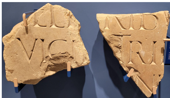
Figura 3. Fragmentos de la inscripción honorífica hallada en el norte del casco urbano calagurritano.