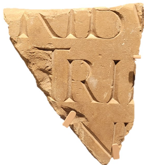
Figura 4. Detalle del Fragmento 1

Hay que destacar la diferencia de tamaño de las letras. Las que están en la primera línea, pese a que han perdido su parte superior, tienen un tamaño superior. La altura de la tercera letra de la primera línea, que es la que más trazo conserva y se identifica como una B, ya es de 5,80 cm. Esto equivale, aproximadamente, a la mitad de su altura que podría