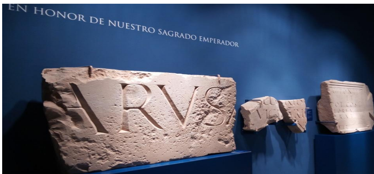
Figura 2. Epigrafía honorífica hallada en Calahorra. (Museo de la Romanización: Sala V "Otium. Culto y juego".).

Las tres inscripciones, posiblemente de una única obra, hacen inviable su completa reconstrucción. El primero tiene unas medidas de (56)x(55)x17 cm y tiene dos líneas de texto que contienen la mención a un emperador gracias a la conservación del título de Augusto. El segundo de (57)x(78)x18 cm apenas conserva dos letras -]VM[- de 38 cm que formaban parte probablemente del acusativo del edificio y el tercero de (62.5)x(105)x 20/22 cm tiene difícil lectura con una línea de texto -]ARVSA[- que pudo corresponder con algún nombre personal.