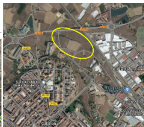
Figura 1. Situación de Calahorra (La Rioja) con la ubicación del lugar del hallazgo epigráfico estudiado (Elaboración propia a partir del visor SignA del IGN).