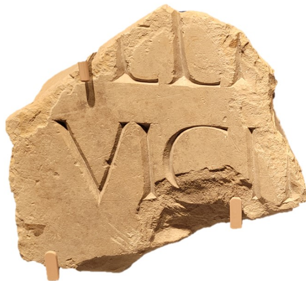
Figura 5. Detalle del Fragmento 2

Por ahora, es imposible confirmar la viabilidad de estas propuestas, si bien, contando con todos los datos, se propone que la inscripción calagurritana homenajeara a dos purpurados donde el segundo mencionado contaba en su onomástica con el nomen Aurelio. La lectura sin proceder a la propuesta de una reconstrucción completa es la siguiente: