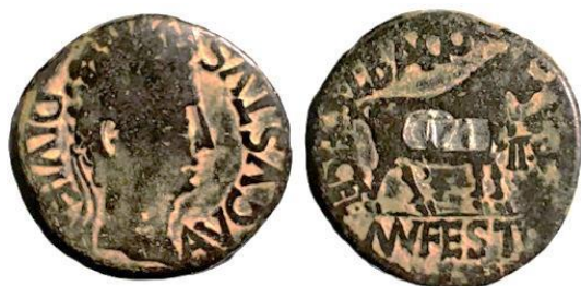
Figura 10. As de Augusto. (RPC 272), (Imag. Subasta Lucernae XIX, 24-10-2024 / lote 208).