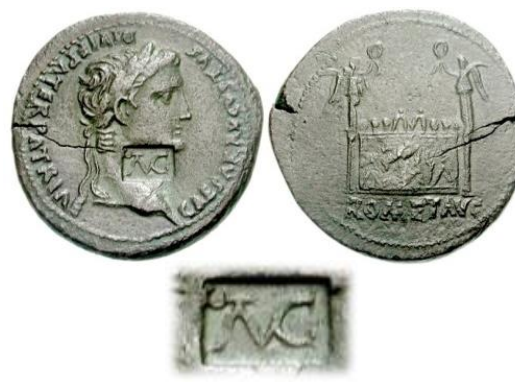
Figura 3. Sestercio Octavio / Lugdunum (RIC I n.º 23.1a).