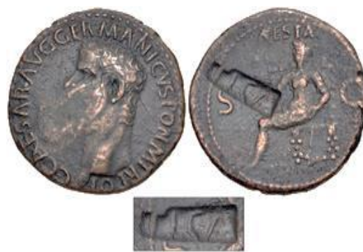
Figura 12. As de Calígula. (RIC 38 (Calígula).