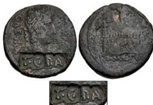
Figura 13. As de Augusto ( Lugdunum). (RIC I n.º 230).