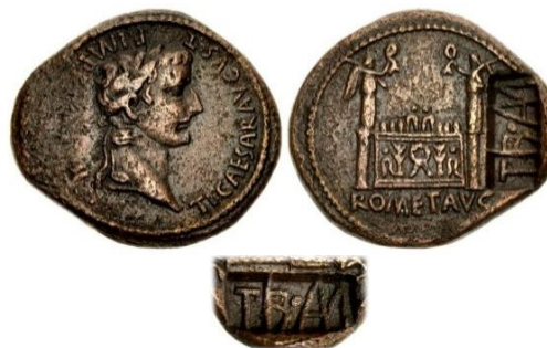
Figura 14. As de Tiberio. (RIC I 245).