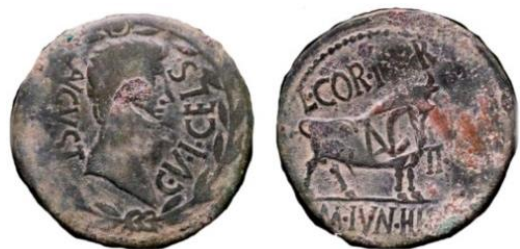
Figura 9. As de Augusto / Colonia Victrix Iulia Celsa. (RPC 270).