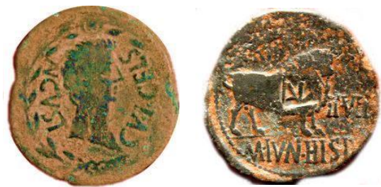
Figura 8. As de Augusto / Colonia Victrix Iulia Celsa. (RPC 270).