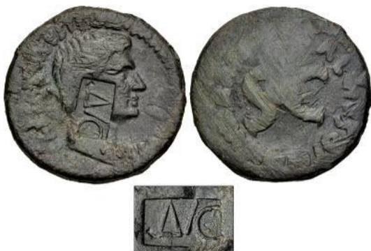
Figura 2. As de Augusto / Pannonia ( Carnuntum) (RIC I n.º 431)