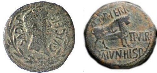
Figura 6. As de Augusto / Colonia Victrix Iulia Celsa (RPC 270).