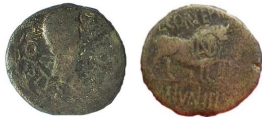
Figura 7. As de Augusto / Colonia Victrix Iulia Celsa (RPC 270).