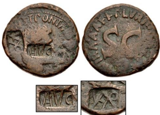
Figura 1. As de Augusto / Germania Inferior (RIC I n.º 431).