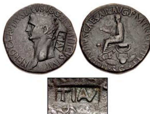
Figura 11. Sestercio de Claudio / Germania Superior. (RIC I 93). (Subasta CNG 111, 29-05-2019 / lote 479).

Esta contramarca puede fecharse en tiempos de Claudio, siendo muy frecuente la abreviatura TI.AV (Fig. 11). Una contramarca, sobre la que sí que se puede establecer comparación con el resto de las fronteras, es la TI en cartela rectangular. Sobre ella se ha escrito bastante, puesto que se han encontrado tanto en Vindonissa (Grünwald: 1946) como en el resto de los campamentos situados en los lugares de avanzadilla del ejército romano. En un principio, se indicó que dicha contramarca había sido aplicada el 6 a.C., fecha en la que el ejército de Germania se sublevó contra Augusto por su despectiva política hacia Tiberio. También era cierto, que entonces las únicas monedas encontradas y contramarcadas con estas iniciales eran las de Augusto, por lo que dicha teoría no era descabellada.