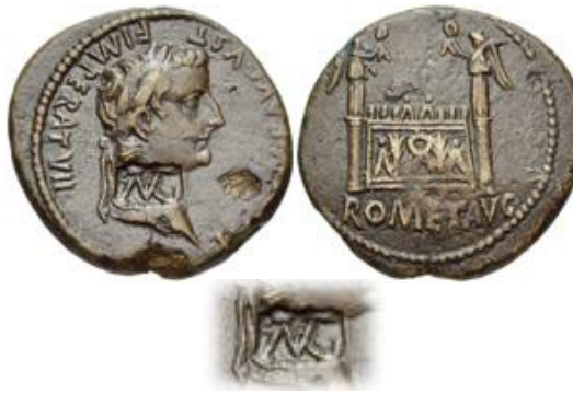
Figura 4. Dupondio de Tiberio (RIC I n.º 244).