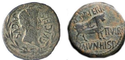
Figura 6. As de Augusto / Colonia Victrix Iulia Celsa (RPC 270).