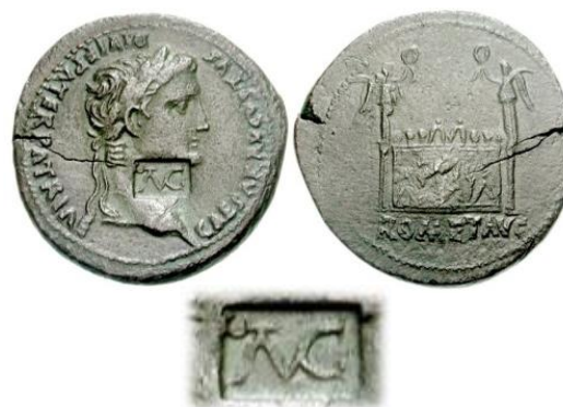
Figura 3. Sestercio Octavio / Lugdunum (RIC I n.º 23.1a).