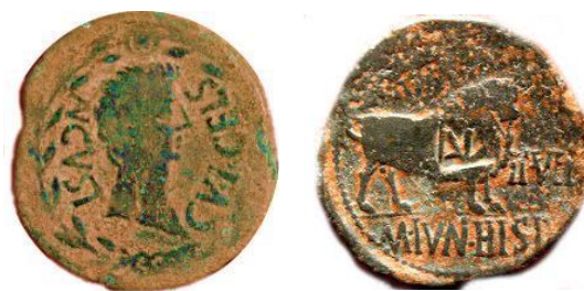
Figura 8. As de Augusto / Colonia Victrix Iulia Celsa. (RPC 270).