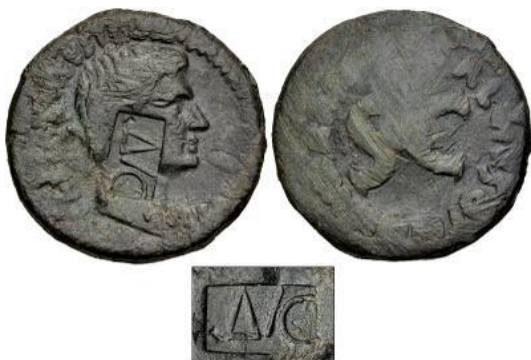
Figura 2. As de Augusto / Panonia ( Carnuntum) (RIC I n.º 431)