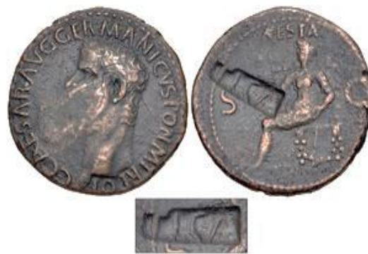
Figura 12. As de Calígula. (RIC 38 (Calígula).