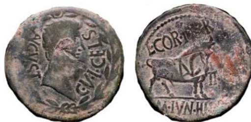
Figura 9. As de Augusto / Colonia Victrix Iulia Celsa. (RPC 270).