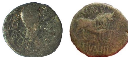
Figura 7. As de Augusto / Colonia Victrix Iulia Celsa (RPC 270).