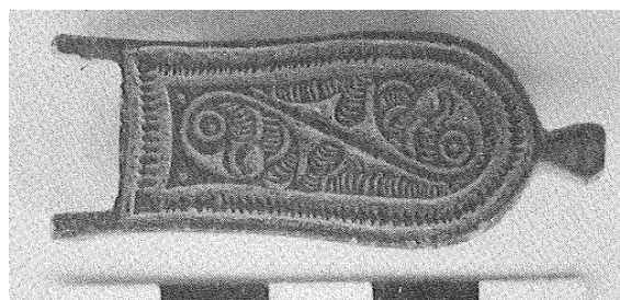
Figura 5. Placa de broche de tipo liriforme perteneciente a la colección de la Casa-Museo "Posada del Moro" similar al ejemplar del Museo de Calatayud (Serrano 1999: 117 fig. 8).

El ejemplar de Illescas tiene un paralelo casi idéntico en la colección de bronce visigodos de la Casa Museo "Posada del Moro" en Torrecampo, Córdoba (Serrano 1999: 116-117, fig. 8) (Fig. 5). El estado de conservación de la pieza 8 no permite ver si son exactamente iguales, pero la similitud de la decoración, y no solo de la forma, es muy evidente.