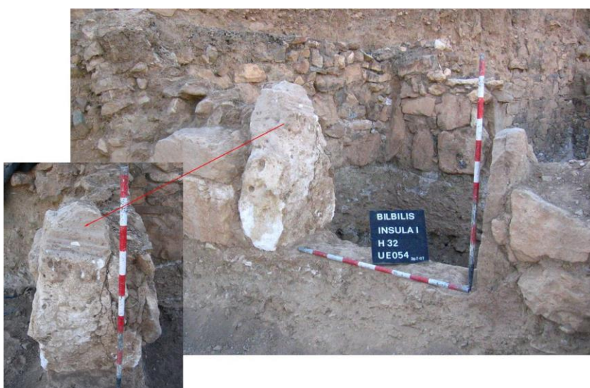
Figura 2. Estructuras de época visigoda documentadas en la Domus 3 de la Insula I (Barrio de las Termas) (Sáenz 2028: 48, fig. 17 y 189). Se han transformado y adaptado varias estancias pertenecientes a la vivienda altoimperial abandonada el siglo III. Corresponden al acceso de dos habitaciones enmarcados mediante bloques verticales de gran tamaño procedentes de la reutilización de elementos arquitectónicos anteriores, principalmente molduras talladas colocadas a modo de jambas, como puede observarse en el espacio H.32 (Imag. Inferior).

Hubo bastantes autores de cronicones que nos realzaron la importancia que tuvo Calatayud y por extensión la antigua Bilbilis , durante el período visigodo (Fig. 2), siendo uno de los más seguidos el de San Hauberto 3 , redactado en el siglo XVII, y ampliamente propagado por el benedictino Fray Gregorio