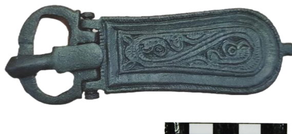
Figura 5. Broche de cinturón liriforme procedente de la zona de Illescas. Calatayud (Museo de Calatayud. N.º Inv. 01613. Imag. C. Sáenz).

La decoración de las dos partes de la placa presenta elementos geométricos y vegetales estilizados y bastantes esquematizados, sin que seamos capaces de poder identificar el tipo de planta representada en la placa. La decoración geométrica puede también identificarse como la esquematización de algún tipo de serpientes, muy presentes en la decoración de las que derivan estas manufacturas hispánicas.