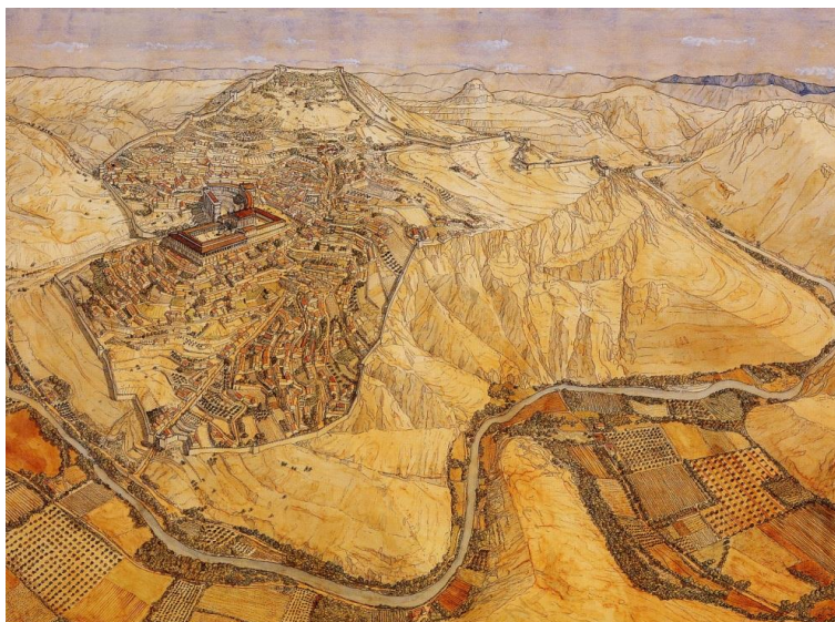
Figura 1. Reconstrucción hipotética de Bilbilis (Según J.P. Golvin y M. Martín-Bueno).

Las menciones a Bilbilis o a Calatayud en época visigoda se resumen en una, y la realiza San Isidoro de Sevilla en sus Etimologías a partir de una conocida referencia que realiza Plinio el Viejo en su Historia