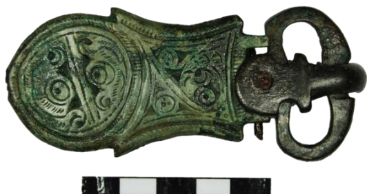
Figura 4. Broche de cinturón liriforme donado al Museo de Calatayud de procedencia desconocida (Museo de Calatayud. N.º Inv. 00808. Imag. N. Guinda).