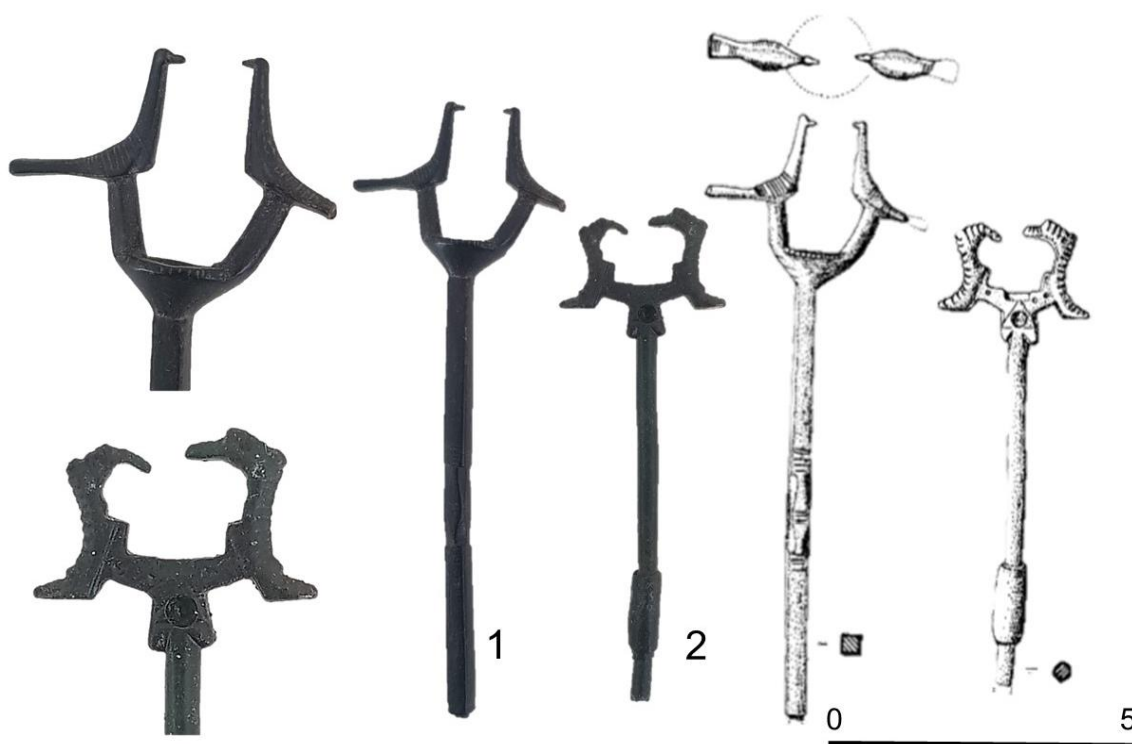
Figura 7. Osculatorios procedentes de Bilbilis. (Sáenz et al. 2019, fig. 26) (Museo de Calatayud: 1. N.º Inv. 00126, 2. N.1 Inv.:00127) (Dibujos: Martín-Bueno, 1975: fig.1: 162; Imag. V. Callejero).

que realizar el ovillo de hilo (Regueras 1990: 175-193; Fernández 2021: 84-95). Esta hipótesis ha tenido muy poca repercusión en la península ibérica, y para algunos como Sáenz Preciado, debe ser descartada. Sin embargo, sí se acepta, el hecho de aparecer estos objetos de forma excepcional en contextos funerarios permitiría hacer una lectura simbólica de la interpretación cristiana del hilado, vinculado a las Parcas 14 , transformando la idea de la prolongación de la vida a la actividad hilandera de la buena esposa/madre (Sáenz et al. 2019: 60).