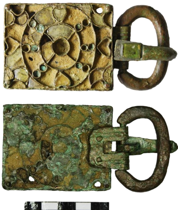
Figura. 3. Anverso y reverso de la hebilla de cinturón con placa articulada de una hebilla donada al Museo de Calatayud de procedencia desconocida (Museo de Calatayud. N.º Inv. 00809. Imag. N. Guinda).

bizantina, donde afirma que estos accesorios de la indumentaria pertenecieron en esa región a la población rural, pero no descarta tampoco que los llevaran los habitantes de las ciudades, debido a que aparecen en las excavaciones de ciudades como Barcelona un gran número (Ripoll 1998: 265).