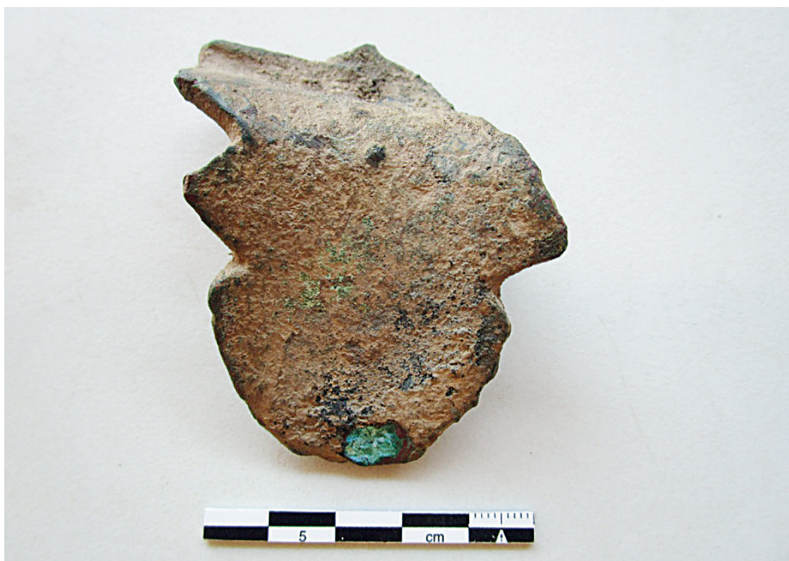
Figura 3: Aplique de situla encontrado en Corral de Ibarra (Sos del Rey Católico) (cara trasera)