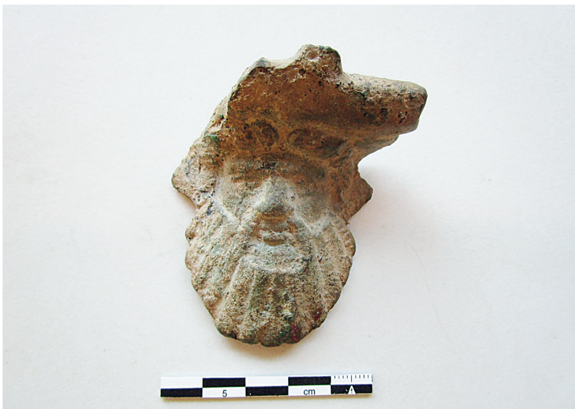
Figura 2: Aplique de situla encontrado en Corral de Ibarra (Sos del Rey Católico) (cara delantera)