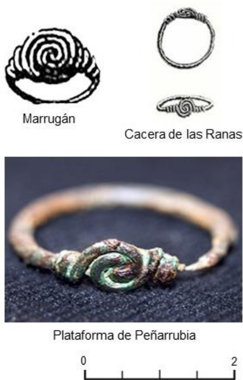
Figura 2: Ejemplares analizados en el texto a partir de las publicaciones disponibles.

La necrópolis de Plataforma de Peñarrubia (Málaga) es una intervención arqueológica realizada ex novo que se encuentra en la región norte de la provincia de Málaga, concretamente en la zona del actual embalse del Guadalteba, a los pies de la Sierra de Peñarrubia, sobre una altitud de 368 msnm (Medianero et al. 2002: 375; Medianero 2006:501).