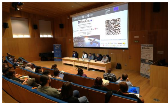
Roll up anunciador y Sesión inaugural del Seminario Internacional HerOn , celebrado en la Facultad de Filosofía y Letras de la Universidad de Zaragoza.

El seminario se estructuró en ponencias marco, presentaciones de estudios de caso y espacios de debate interdisciplinar.