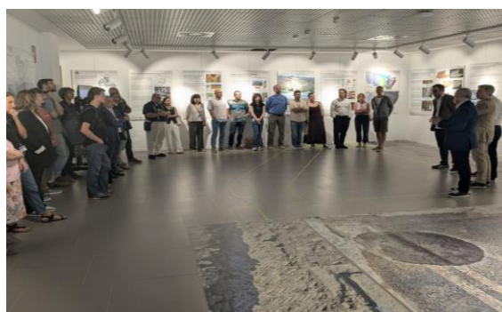
Cartel anunciador y acto inaugural de la exposición Arqueología Digital: del satélite a la tierra en la Sala de Exposiciones de la Facultad de Filosofía y Letras de la Universidad de Zaragoza.