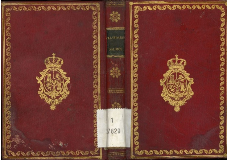
Fig. 5: Encuadernación artística de la obra Afectos devotos para ejercicio y consuelo de las almas espirituales...

En cuanto a las encuadernaciones restantes, hay que tener en cuenta que dos de las obras son multivolumenes – El Bachiller de Salamanca ó Aventuras de D. Querubin de la Ronda con dos volúmenes y Año militar, kalendario de santos soldados con cinco– mientras que los libros Milicia, discurso y regla militar y Discurso sobre la forma de reducir la disciplina militar à mejor y antiguo estado forman un volumen facticio. Por lo tanto, el número de ejemplares, quince no coincide con el número de encuadernaciones, diecinueve, de las cuales doce son en pergamino, cuatro en piel jaspeada y tres en pasta española.