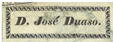
Fig. 1: Modelo de etiqueta impresa que presenta la contratapa anterior de la mayoría de los ejemplares de José Duaso.