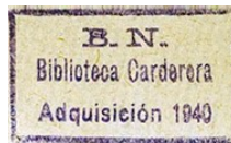
Fig. 8: Sello de Valentín Cardenera hallado en el ejemplar Relacion de las reales exequias que se celebraron por el señor D. Luis primero rey de España, nuestro señor que esta en el cielo .

artistas destacados de la segunda mitad del siglo XVII y primer cuarto del siglo XVIII.