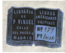
Fig. 10: Etiqueta de la librería de Pedro Vindel.

siguen sirviendo de base para los actuales bibliotecarios e investigadores que se dedican al patrimonio bibliográfico.