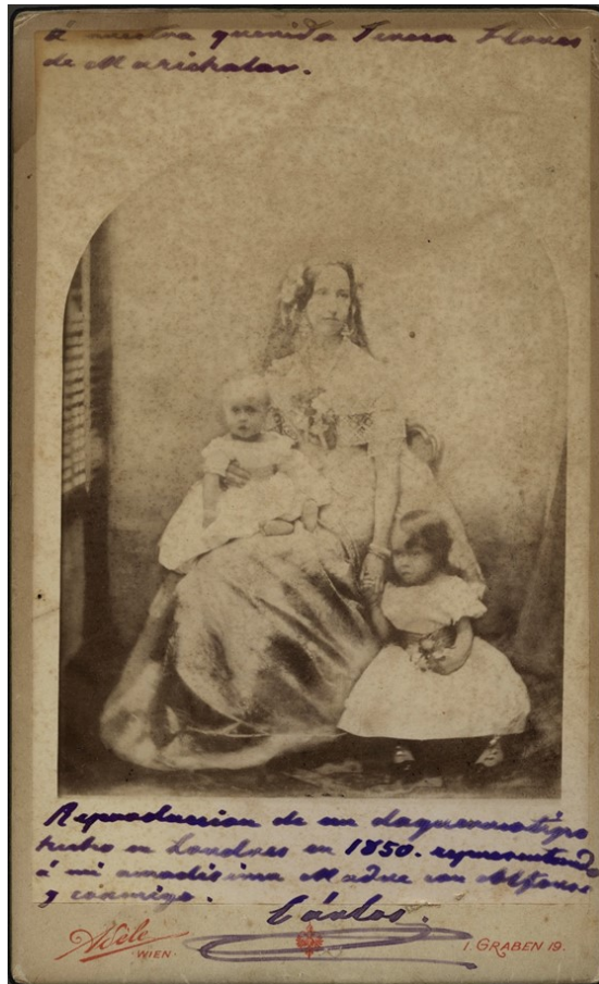
Beatriz de Austria-Este junto a sus hijos Carlos y Alfonso.

En 1869, con sus hijos ya adultos, tras el matrimonio de Carlos y el ingreso de Alfonso en el cuerpo de zuavos pontificios al servicio del Vaticano, María Beatriz dio un giro a su vida y decidió recluirse en el convento de monjas carmelitas de Graz (Austria). Solicitó permiso previo al Papa y también a su marido, de quien obtuvo como respuesta «Por mí no hay inconveniente alguno; piensa sólo si será bueno para tu salud», 6 e informó a la congregación para que autorizaran su ingreso de que su esposo Juan se había convertido en un enfermo mental 7 .