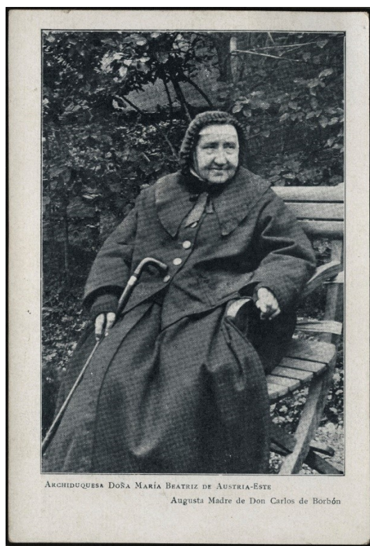
María Beatriz de Austria-Este. Museo del Carlismo. Gobierno de Navarra.

Finalmente, la localización de ejemplares en catálogos bibliotecarios nos ha permitido saber que, aunque inicialmente toda la obra de la archiduquesa se publicó en la tipografía Emiliana, entre los años 1893 y 1895 se reeditaron al menos 14 obras en la tipografía Salesiana de St. Pier d'Arena.