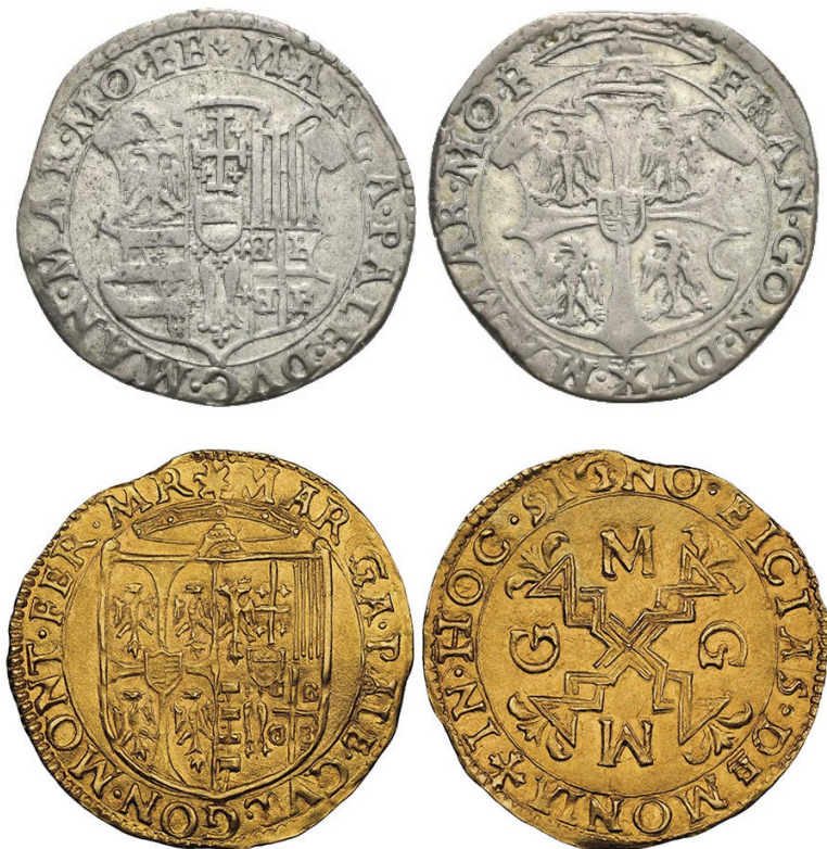
Fig. 4: Monedas de Margarita Paleóloga como regente de sus hijos

A la muerte de Margarita, y precisamente en Trino, 19 la Academia degli Illustrati, publica la obra Le lagrime de gl'Illustrati Academici di Casale in morte dell'illustrissima et eccellentissima madama Margherita Paleologa duchessa di Mantoua, et marchesana del Monferrato , impresa en 1567 (In Trino, appresso Gio. Francesco Giolito de' Ferrari), en cuya portada aparece el escudo conjunto de los Gonzaga de Mantua y los Paleólogo de Montferrato siguiendo el modelo de la última moneda comentada. 20