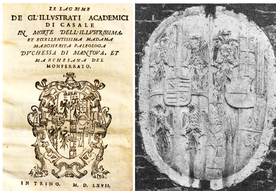
Fig. 5: Heráldica conjunta de los Gonzaga-Paleólogo