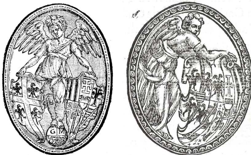
Fig. 2: Marcas heráldicas de Guillermo de Millis (modelos 1 y 2)

una esfera con las iniciales GM 9 y la segunda simplemente como «Un ángel sosteniendo un escudo», 10 lo cual dista mucho de identificar correctamente lo que aparece dentro de los escudos, y desde luego no explica su significado y origen.