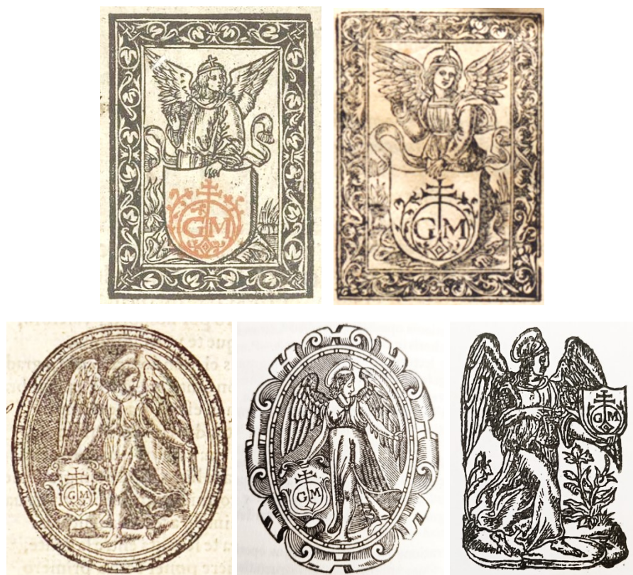
Fig. 1: Modelos de marcas de ángeles de Guillermo de Millis

Todas ellas son muy similares y se diferencian simplemente por su diseño específico, pero las partes más significativas son iguales en todas ellas, en especial el escudo que incluye el diseño concreto con la marca específica que lleva las iniciales del impresor. Pero Millis, sin motivo aparente, va a usar otra marca a partir de 1551, sin dejar de usar las anteriores, con un diseño muy distinto, en dos modelos, que manteniendo al ángel (aunque sin nimbo), es claramente heráldica y creemos que sólo se puede entender estudiando sus orígenes familiares.