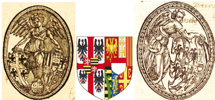
Figura 6, Las marcas de Guillermo de Millis y su modelo heráldico

con las monedas mostradas anteriormente para certificar sin ningún género de dudas su origen. 26