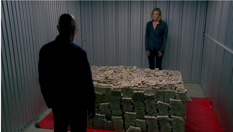
Ilustración 2. Walter y Skyler White, frente a la «gran hazaña» de Heisenberg

Tras vislumbrar ese logro, da la sensación de que algo cambia en White. En una escena posterior, lleva una enorme bolsa llena de dinero a su antiguo compañero, Pinkman, al que expulsó del negocio. Más adelante, le comunica su decisión a su esposa: «I'm out» (Gilligan, V, 8, 42:30).