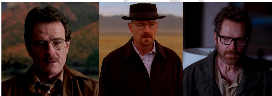
Ilustración 1. Walter White y su evolución física. A la izquierda, antes de entrar en el mundo de la droga; en el centro, cuando ya era Heisenberg; y a la derecha, en sus momentos finales.

Es de esta manera cómo White recorre el camino que él mismo ha escogido hasta sus últimas consecuencias, hasta que queda muy poco del White que se presentaba al principio —ese profesor de instituto apocado, padre de familia y respetuoso con los demás— para mostrar en todo su esplendor a Heisenberg, a quien ya no le tiembla el pulso para lidiar con las dificultades de un negocio como la manufacturación de metanfetamina. Este «proceso» entre la conversión de White a Heisenberg se refleja incluso en el mismo físico del personaje, que adopta el rapado (al principio como solución a la caída capilar por la quimioterapia), el sombrero y la perilla como apariencia.