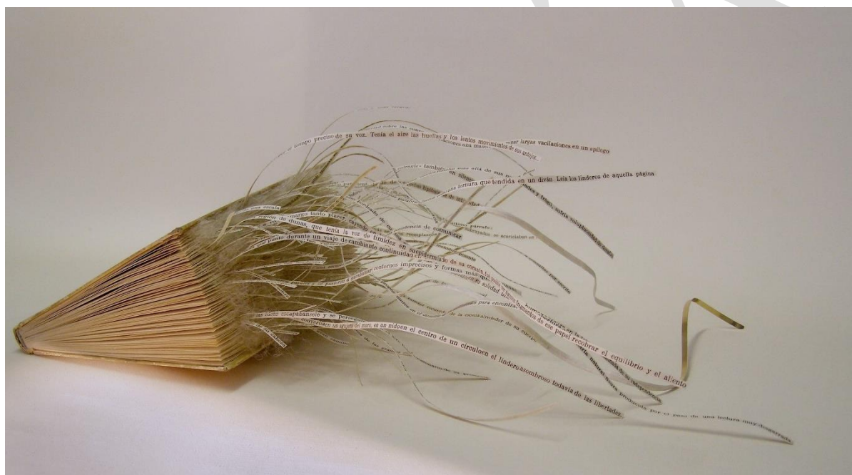
Fig. 5. Serie Asonmbros .

Hasta cierto punto la serie Asonmbros (2007-2009) de Mar Arza me sugiere también pequeños espacios arquitectónicos de los cuales se escapan las palabras. Son los propios libros, esta vez, los que conforman unas estructuras a modos de pequeñas casas y sorprendentes libros objeto de los que surgen y se entrelazan escultóricamente las palabras, al fin y al cabo: «El reino del libro no tiene sus fronteras entre sus tapas sino que se extiende por la realidad circundante, arraigando castillos en el aire» (Arza, 2007-09).