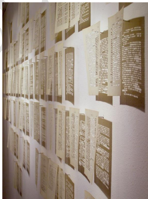
Fig. 2. Serie En lugar de nada .

Es quizá el momento de pasar de la cicatriz al cuchillo y a una obra mucho más reciente como es Femme Couteau [after L. B.]. Esas iniciales (lo habrán adivinado) pertenecen a la escultora Louise Bourgeois, quien en su momento hiciera su Femme Couteau , esa extraordinaria pieza donde se adivina tanto un símbolo fálico-arma como unos genitales femeninos. Se pregunta Bourgeois: «¿Por qué las