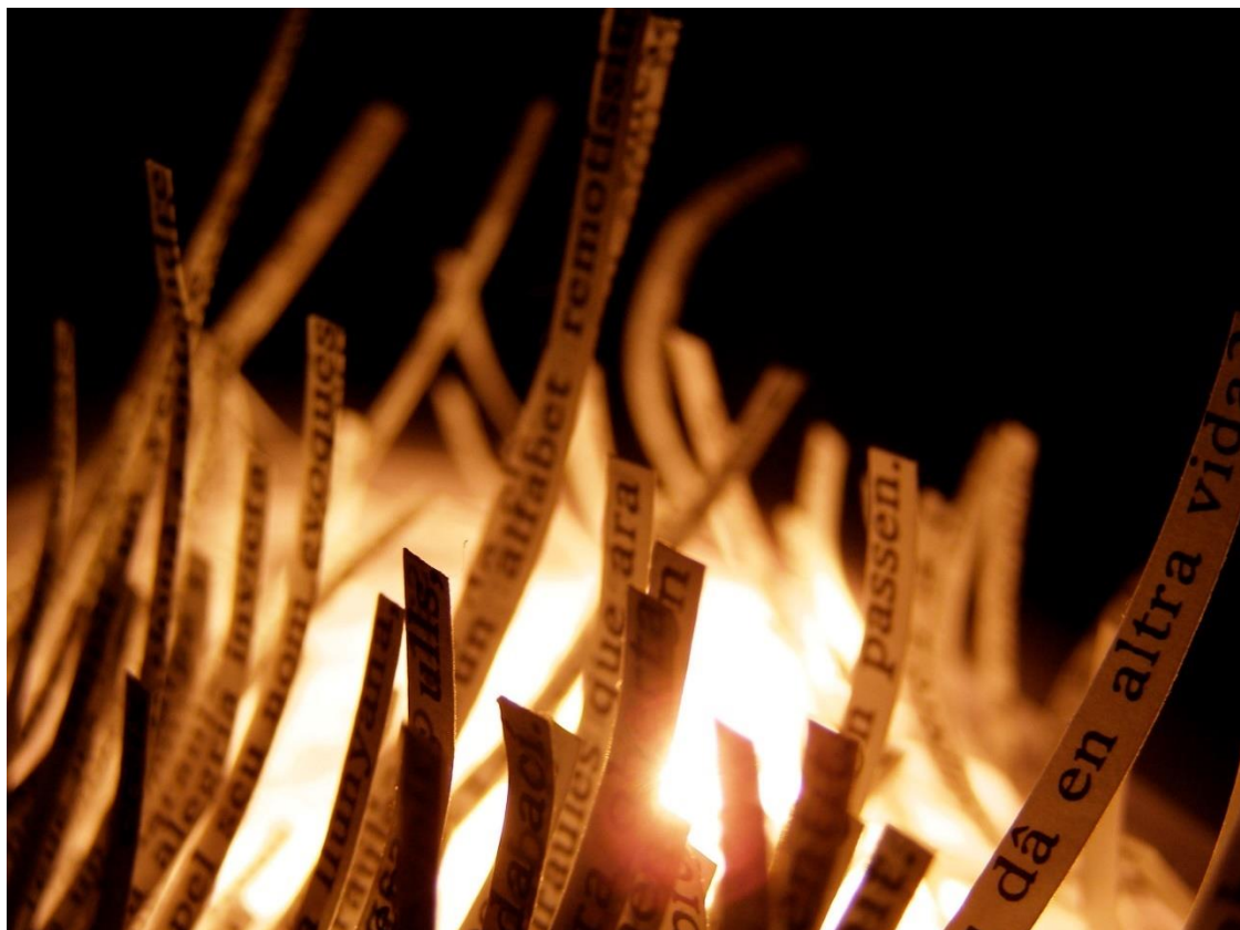
Fig. 6. Serie Lluerna Ulls.

Lluerna ulls , de difícil traducción al castellano en la suma de sus dos palabras (claraboya y ojos) es anterior en el tiempo (se fecha en 2007) a la serie Asombros .