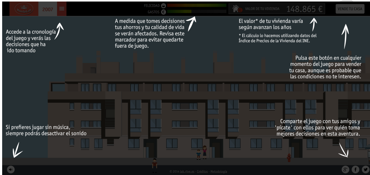
Figura 3: Interfaz e instrucciones de Montelab (RTVE.es, 2014)

Cuando se pulsa el botón de comprar, se abre la interfaz del juego propiamente dicho (figura 3). Se trata de un juego en 2 dimensiones de diseño muy sencillo y con tres variables principales: felicidad, gastos y valor de la vivienda. No se transmite un objetivo claro, sino que se invita a disfrutar de la experiencia: “Vive la experiencia de comprar un piso en plena burbuja inmobiliaria”. Una parte muy importante del juego es, por tanto, descubrir las normas conforme avanza la partida.