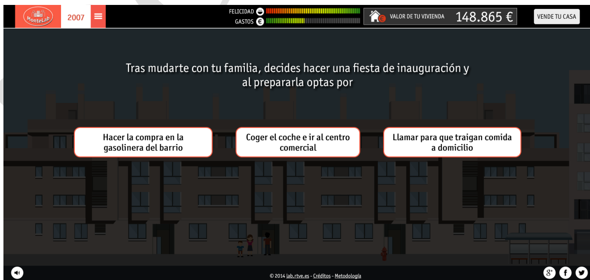
Figura 4: Modelo de toma de decisiones en Montelab (RTVE.es, 2014)

El jugador encarna a uno de los personajes que componen la familia escogida y, aunque se puede mover al personaje en varias direcciones, la historia solo avanza cuando vamos hacia adelante. Al unirse a su familia, surge una situación sobreimpresa con tres opciones entre las que hay que elegir (figura 4). Este modelo de toma de decisiones es el núcleo central del videojuego, una prueba que se repetirá constantemente y marcará el desarrollo de la historia