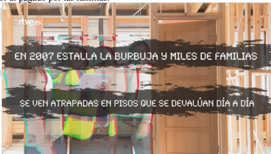
Figura 1: Captura de Montelab (RTVE.es, 2014)

El montaje de este vídeo ya presagia el tono satírico y de denuncia que tiñe cada elemento de Montelab . Esta introducción se presenta como una promoción inmobiliaria que interpela al jugador para comprar una casa; tanto la locución como la música de fondo son exageradas para subrayar la falsedad de esta propuesta. La denuncia se manifiesta a través de pequeños ‘cortes’ en el vídeo que, a modo de interferencia clandestina (figura 1), boicotea el discurso normativo para denunciar la realidad: las urbanizaciones con piscina y jardín dieron paso a instalaciones sin los servicios básicos, cuyo valor era muy inferior al pagado por las familias.