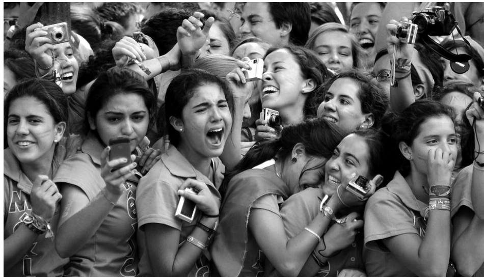
[Fig. 8] Enric Jardí. Sin título.