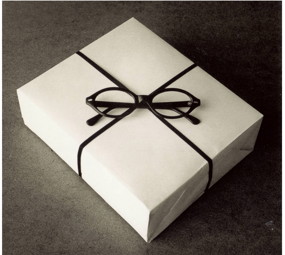
[Fig. 5] Chema Madoz. Sin título.

FCO. JAVIER LÓPEZ RIVERA Sobre la representación y comunicación de las ideas. Fotografías e imágenes