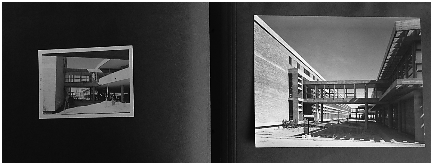
[Fig. 6] Fotografía del arquitecto frente a la del fotógrafo profesional. Album Fernando Moreno Barberá.