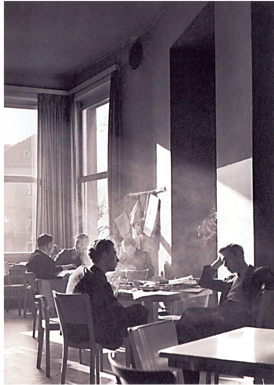
[Fig. 4] Hans Baumgartner. Residencia de estudiantes. Zúrich (Suiza). 1936.