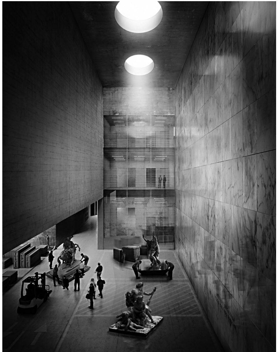
[Fig. 9] Campo Baeza- Raphaël Gabrion. Propuesta para Museo del Louvre. Lièvin (Francia). 2015.

FCO. JAVIER LÓPEZ RIVERA Sobre la representación y comunicación de las ideas. Fotografías e imágenes