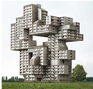
[Fig. 7] Filip Dujardin: Guimaraes (2012).