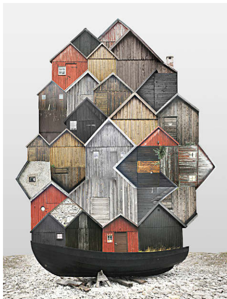
[Fig. 10] Anastasia Savinova: 'Genius Loci / SE / Fårö' (serie Genius Loci , 2015).