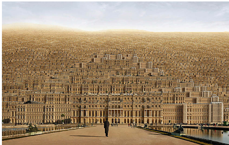
[Fig. 11] Jean-François Rauzier: Versailles (2010).