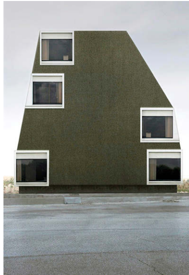
[Fig. 5] Xavier Delory: 'East View' (serie Rietveld van Doesburg House , 2017).