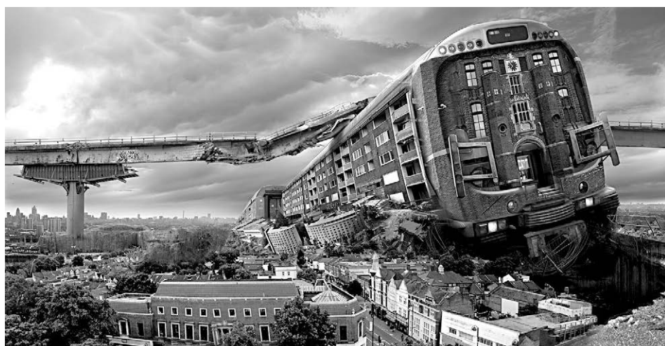
[Fig. 17] Barbara Nati: No Farewell, only Endless Goodbyes #6 (2013).