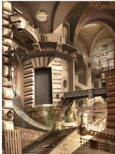
[Fig. 13] Du Zhen Jun: 'The Tower of Babel, the wind' (serie Babel World , 2010).