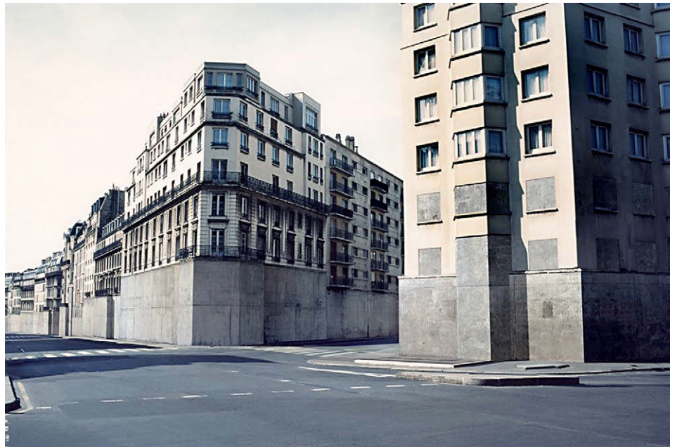
[Fig. 18] Pouria Khojastehpay: 'Crimewavedam' (serie Dustwound, 2016).