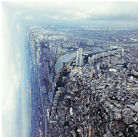
[Fig. 8] Pete Ulatan: London Invasion (2016).