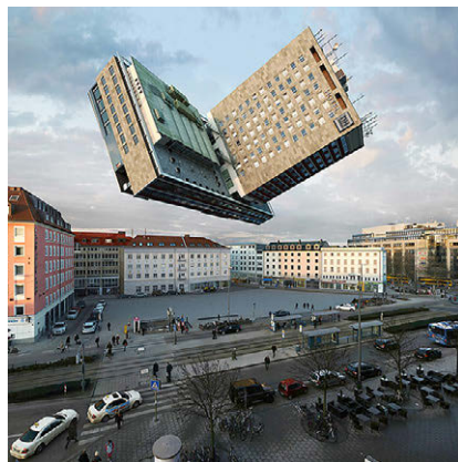
[Fig. 15] Scott Mutter: Untitled (Card Catalogs Under City), 1986.