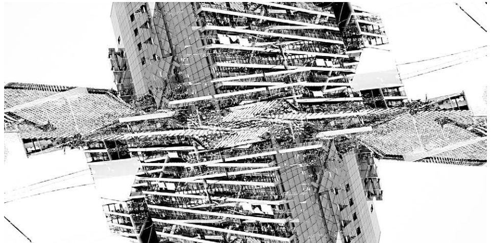
[Fig. 9] Kazuhiko Kawahara: '1_building 2' (2008).

de arquitecturas fotografiadas, fomentada por la difusión, exponencialmente aumentada, ofrecida por las redes digitales de comunicación. Entre ellas hay, desde luego, una amplísima variedad de enfoques, intereses y calidades, incluyendo desde profesionales de pericia técnica comparable a la de Schaerer o Dujardin, a aproximaciones realizadas desde la frontera con lo amateur . Sin embargo, todas ellas contribuyen, en mayor o menor medida, a la generación de un humus visual, del mismo modo que los collages realizados por los artistas de principios del siglo XX pasarían a formar parte de un imaginario arquitectónico que hoy en día crece más allá de lo abarcable. Al igual que entonces, la fascinación por la fragmentación de la percepción ha caracterizado el cambio de siglo. Fotógrafos como Serge Mendzhiyskogo, Adrian Brannan, Thomas Kellner, Masumi Hayashi o Seung Hoon Park dan fe de ello en sus vistas compuestas por la sutura de imágenes tomadas en diferentes momentos y/o con diferentes angulaciones que reconstruyen una nueva mirada caleidoscópica: aquella engendrada en una realidad, la de la imagen digital, en la que el pixel se ha transformado en la unidad de medida visual 30 .