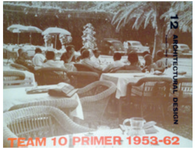
[Fig. 6] Alison Smithson (ed.), “Team 10 Primer 1953-1962”, Architectural Design 12 (diciembre 1962).