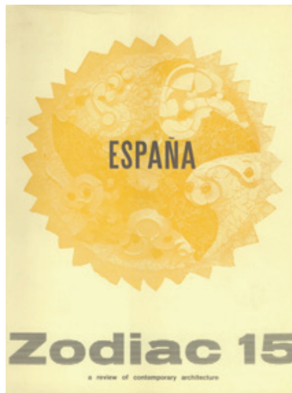
[Fig. 10] España, Zodiac, A review of contemporary architecture 15 (1965).

intención pedagógica, el tránsito de la Tercera Generación hacia una arquitectura orgánica que, según planteaba Bruno Zevi (miembro destacado de esta misma generación), debía ser la evolución natural de la arquitectura moderna. Al plantear tal criterio hay obras, sin duda importantes, que se dejan a un lado (por ejemplo el Gimnasio de Colegio Maravillas de Alejandro de la Sota) aunque desde este enfoque la obra ya construida en Alcadia por Sáenz de Oíza, o el proyecto de Torres Blancas, adquieran todo su sentido.