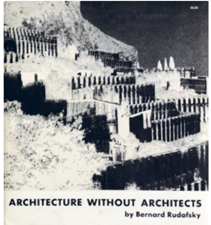
[Fig. 4] Bernard Rudofsky, Architecture without Architects (Nueva York: Museum of Modern Art, 1964).

[fig. 2] 2 . This exhibition included works by architects belonging to the first two generations, and the ideas that connected their designs were completely removed from time and asserted themselves in the principles capable of defining a style. Later, these same authors published their text on the International Style [fig. 3] 3 , in which they established the formal conditions that make it possible to recognise modern architecture and asserted the principles that made an entire movement identifiable; the text included a selection of examples, most of them European and constructed around the 1930s, that they attempted to use to reinforce their ideas and the critical discourse. It is interesting to observe that this wish to give stylistic consistency to European architecture took place in the United States and that the critical foundations, which were even questioned later by their own authors, were prepared by a historian and an architect, both Americans and belonging to the second generation.