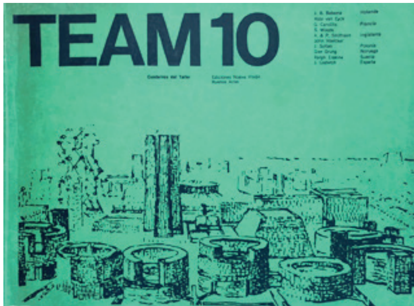
[Fig. 8] Alison Smithson (ed.), Manual del TEAM 10 . Col. Cuadernos de Taller (Buenos Aires: Nueva Visión).

America, although with a different format from the English edition [fig. 8] 8 . The collection of texts, ideas and manifestos shows a typography, layout and drawings to represent a free, and actually different, spirit. The initial text about “The Role of the Architect”, prepared by Aldo van Eyck, offered an idea of the approach that the group proposed to connect architecture with the social sciences and, thereby, incorporate the relationship between space and its inhabitants from a truly humanist point of view.