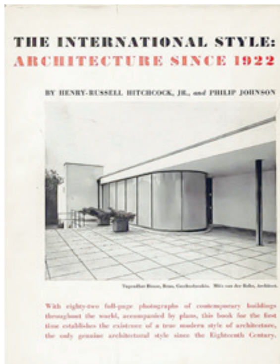
[Fig. 3] Henry-Russell Hitchcock y Philip Johnson, The International Style: Architecture since 1922 (Nueva York, Londres: Norton, 1960).

En torno a la Tercera Generación. Perspectiva desde un centenario (1918-2018) On the Third Generation. Perspective One Century Later (1918-2018)