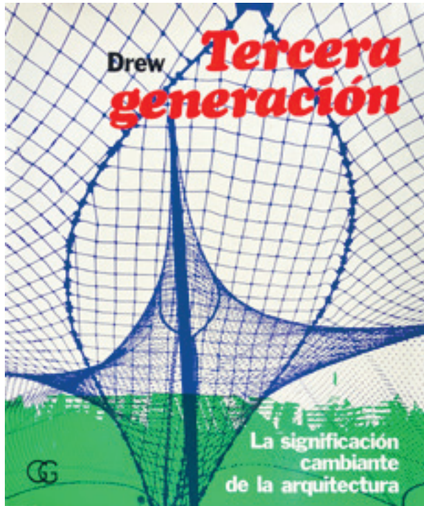
[Fig. 1] Philip Drew, Tercera generación . La significación cambiante de la arquitectura (Barcelona: Gustavo Gili, 1973).

En torno a la Tercera Generación. Perspectiva desde un centenario (1918-2018) On the Third Generation. Perspective One Century Later (1918-2018)