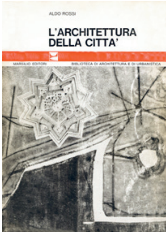
[Fig. 11] Aldo Rossi, L'architettura della città (Padua: Marsilio, 1966).