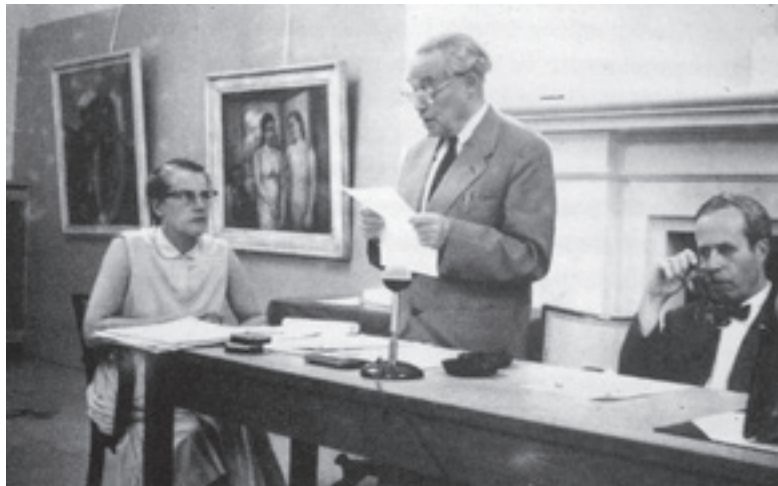
[Fig. 5] Sigfried Giedion lee la carta de Le Corbusier a los asistentes al Décimo CIAM reunido en Dubrovnik en 1956. José Luis Sert, con expresión preocupada, está sentado a su izquierda.

En torno a la Tercera Generación. Perspectiva desde un centenario (1918-2018) On the Third Generation. Perspective One Century Later (1918-2018)