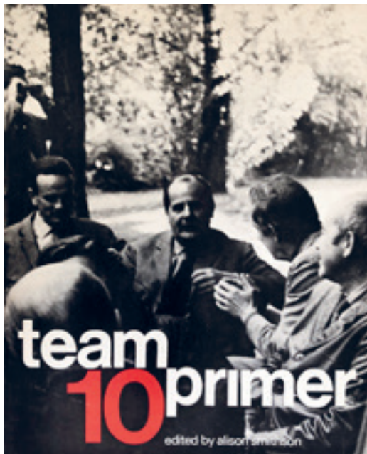
[Fig. 7] Alison Smithson (ed.), Team 10 Primer (Cambridge, Londres: MIT Press, 1968).

En torno a la Tercera Generación. Perspectiva desde un centenario (1918-2018) On the Third Generation. Perspective One Century Later (1918-2018)