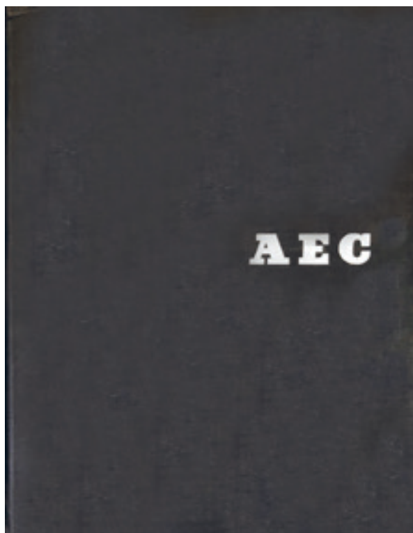
[Fig. 9] Carlos Flores, Arquitectura Española Contemporánea (Bilbao, Editorial Aguilar, 1961).

En torno a la Tercera Generación. Perspectiva desde un centenario (1918-2018) On the Third Generation. Perspective One Century Later (1918-2018)