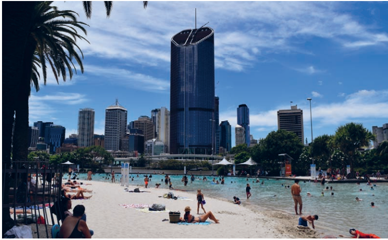
[Fig.1]. Southbank de Brisbane. Playa creada en parte de la ubicación de la Expo88.

Megaeventos y restauración del suelo urbano Mega events and the restoration of urban land