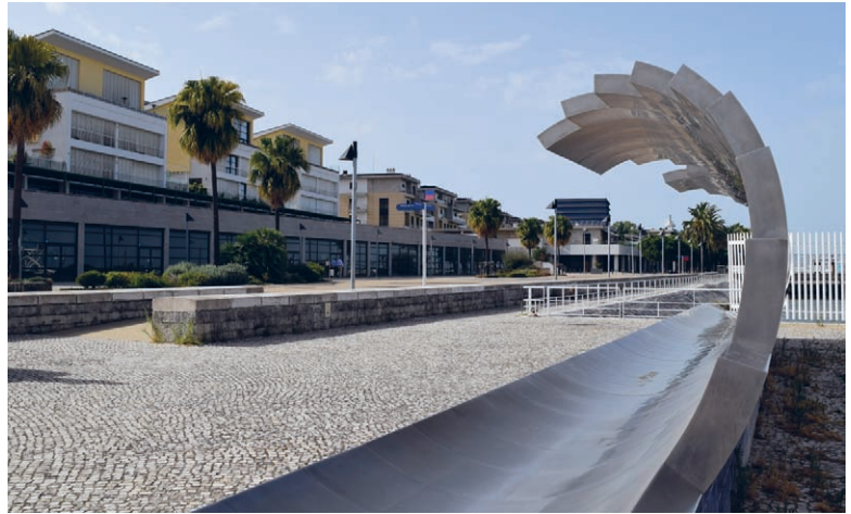
[Fig.2]. Lisboa, Parque das Nações . Reurbanización de la ribera incorporada a la Expo98.