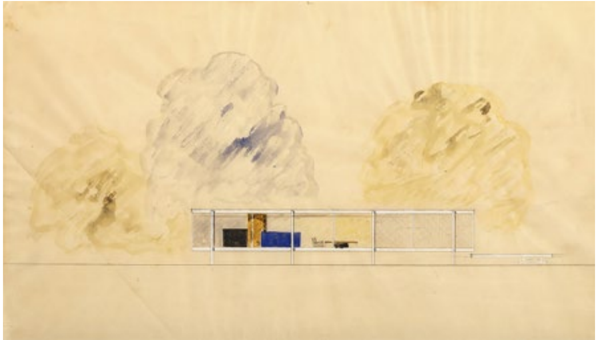
Ludwig Mies van der Rohe. Farnsworth House, Plano, Illinois. Alzado. 1945. / Ludwig Mies van der Rohe. Farnsworth House, Plano, Illinois. Elevation. 1945.

intends to surpass that first science whose reason had fragmented the world into pieces of little truths in order to embrace that other science that tells of a world and a nature to which we belong and where we can achieve our own domestic Eden. A belonging that seems to be able to solve old material and energy offenses to nature itself.