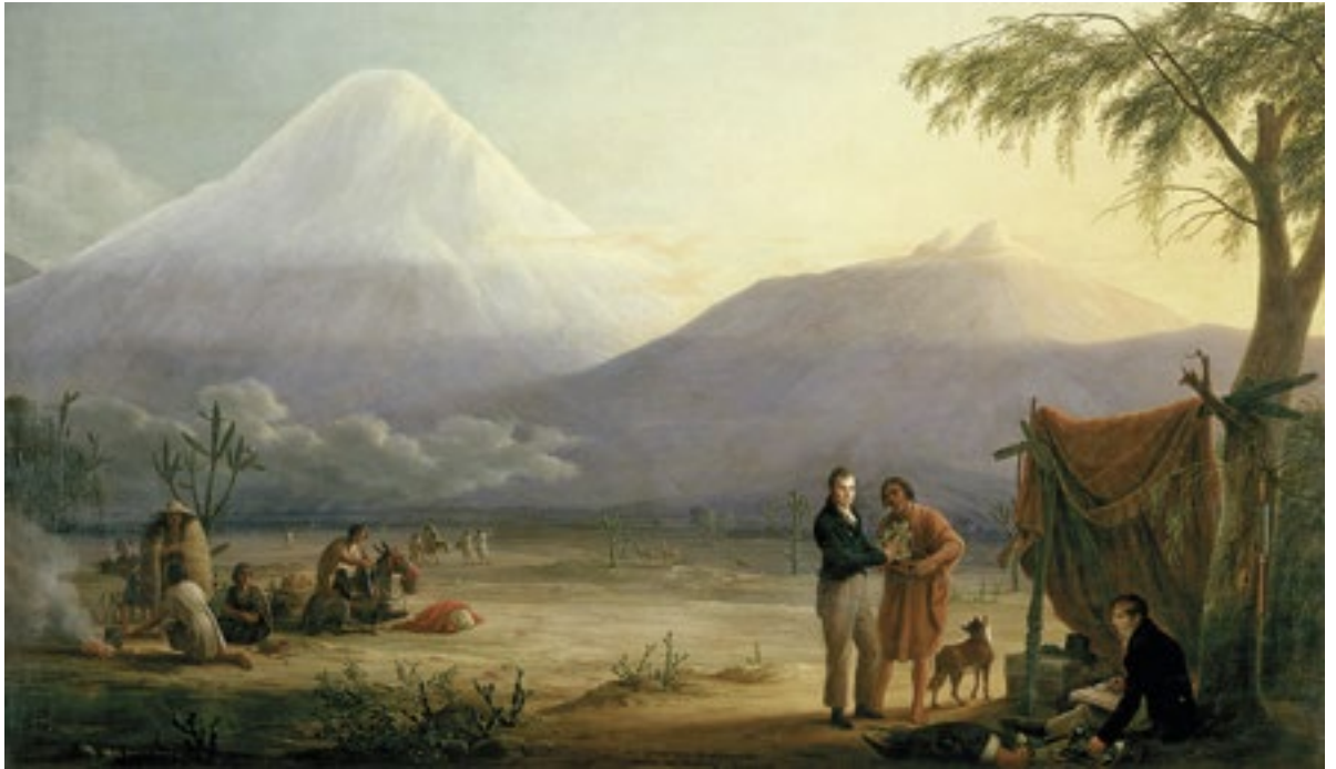
Alexander von Humboldt y Aimé Bonpland a los pies del volcán del Chimborazo. Friedrich Georg Weitsch. 1806. / Alexander von Humboldt and Aimé Bonpland on the foot of the vulcano Chimborazo. Friedrich Georg Weitsch. 1806.

Para este viaje parece necesario la identificación de todas estas naturalezas domésticas que abonan la posibilidad de una nueva casa y un nuevo habitar. Un habitar que pretende superar a esa primera ciencia cuya razón había fragmentado el mundo en trocitos de pequeñas verdades, para abrazar otra ciencia que dice de un mundo y una naturaleza a la que pertenecemos y en la que podemos lograr nuestro propio edén doméstico. Una pertenencia que parece poder resolver viejos agravios materiales y energéticos hacia la propia naturaleza.